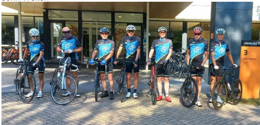
Deelnemers Veluwe fietsweekend