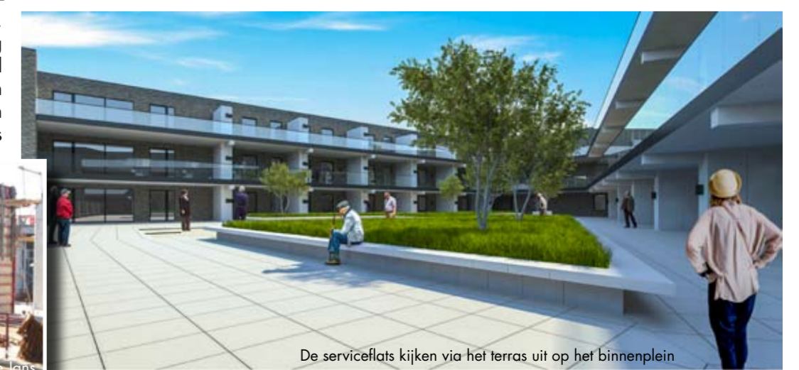
De serviceflats kijken via het terras uit op het binnenplein