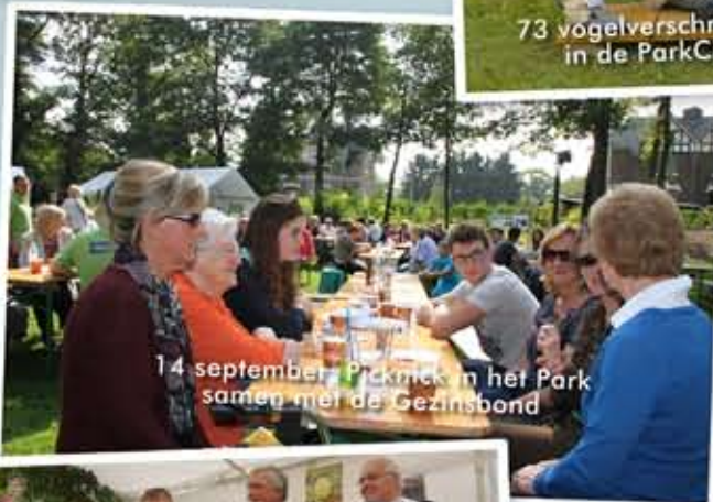
14 september: Picknick in het Park samen met de Gezinsbond