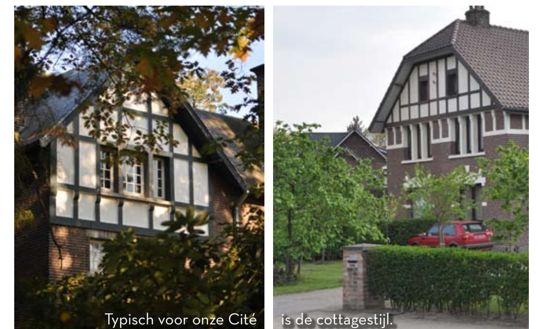
Typisch voor onze Cité