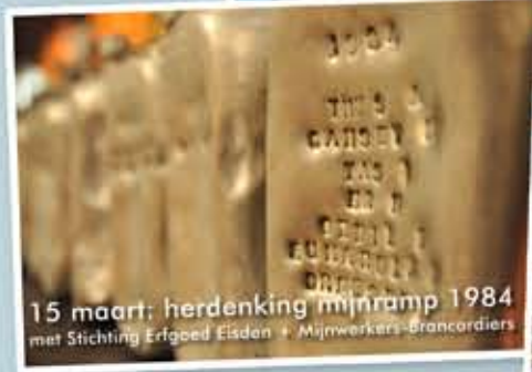
15 maart: herdenking mijnramp 1984 met Stichting Erfgoed Eisden - Mijnwerkers-brancardiers