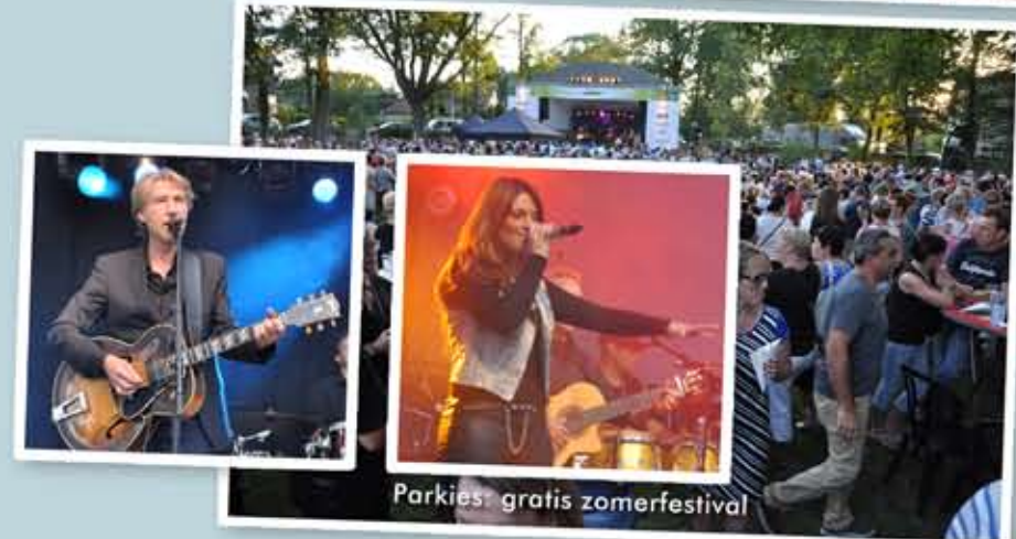
Parkies: gratis zomerfestival