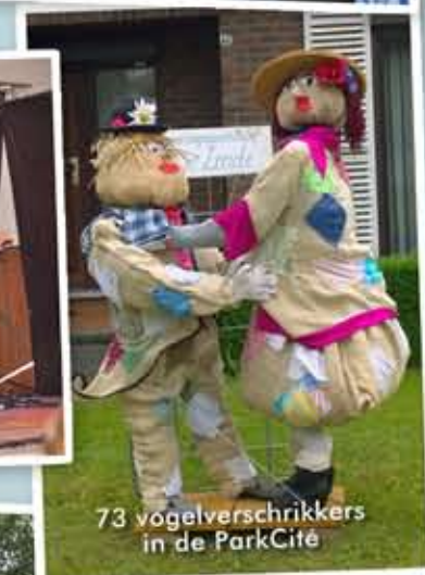
73 vogelverschrikkers in de ParkCité