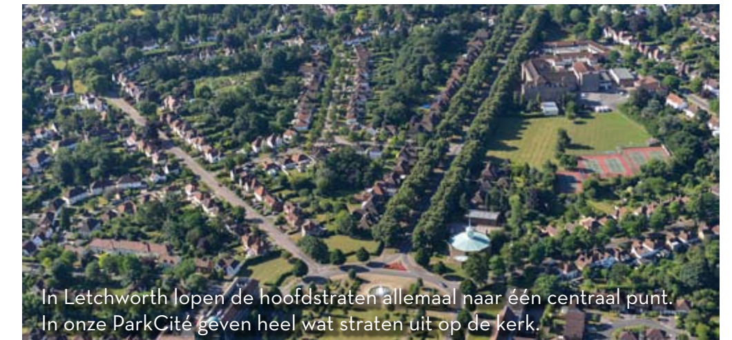
In Letchworth lopen de hoofdstraten allemaal naar één centraal punt. In onze ParkCité geven heel wat straten uit op de kerk.