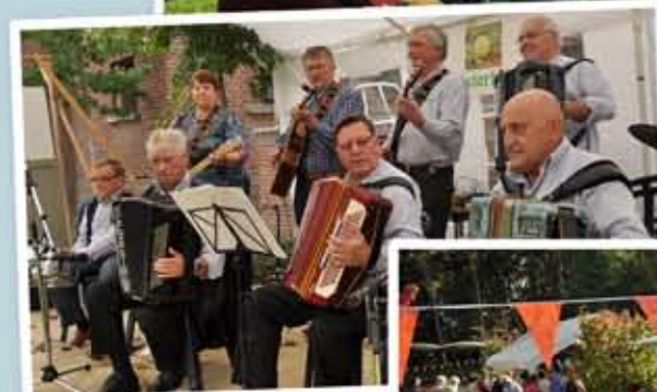
12 oktober: Kastanje-feest samen met De Bolster