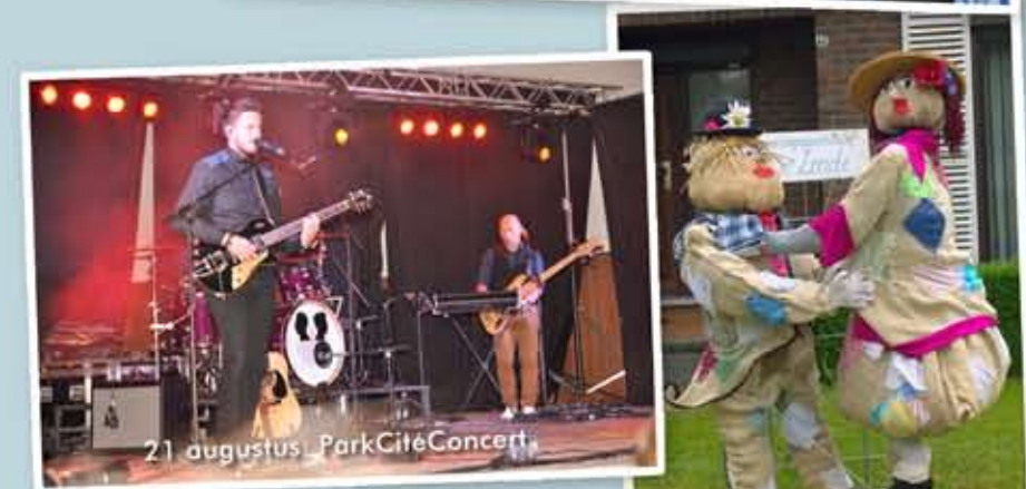
21 augustus: ParkCitéConcert