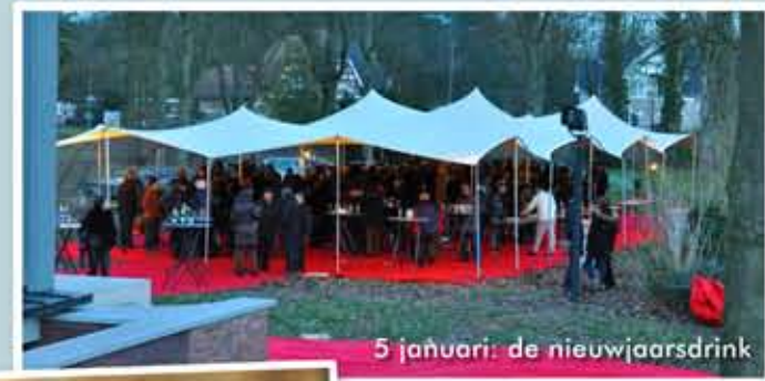
5 januari: de nieuwjaarsdrink