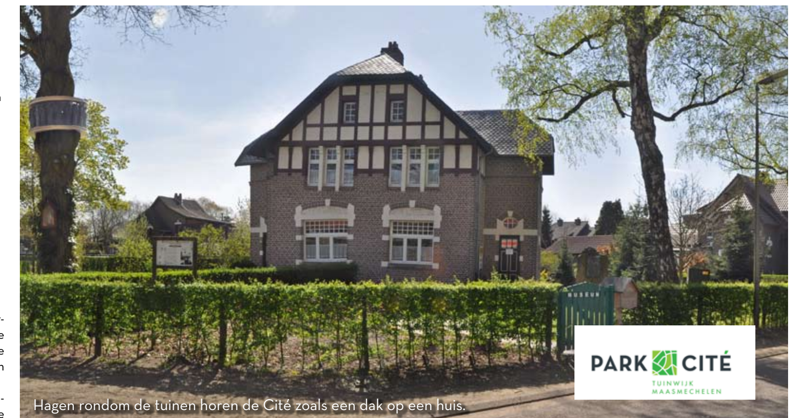
Hagen rondom de tuinen horen de Cité zoals een dak op een huis.