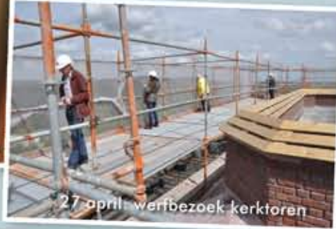
27 april: werkbezoek kerktoeren