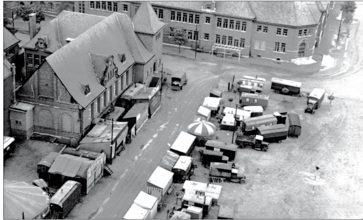
1948. De tweede zondag van juli is het nog altijd Citékermis. In die dagen toen niemand met vakantie ging en de mijnwerkers hun jaarlijkse "congégeld" ontvingen, was die kermis een der grootste van het Maasland.

Zondag 10 juli is het cité-kermis. In de gouden periode van de steenkool-industrie één van de meest attractieve en voor de foorkramers ook rendabelste kermissen in het Maasland. Midden juli was ook een ideale timing want de mijnwerkers hadden dan net hun 'congégeld' opgestreken en trakteerden tijdens de kermisdagen gul vrouw en kinderen. De eerste kermis- sen op onze cité vonden plaats op het plein dat gevormd wordt door de Bosjesstraat, Kapelstraat en Heidestraat. In 1929 verhuisde de kermis naar het grasplein op de hoek van Natiën- en Eikenlaan aan de kerk, om nog later door te schuiven naar het kerkplein. Het mijnbestuur organiseerde trouwens tot in de naoorlogse jaren alle festiviteiten die doorgingen op kermisdagen. Zo werd op het oorspronkelijke kermisplein aan de Kapelstraat al voor de eerste wereldoorlog een podium en dansbak opgebouwd. De zwik, een grote danstent, hoorde er later steevast bij. Concerten, fakkeltocht, voetbal- en kaatsbalwedstrijden, turnfeest en vuurwerk maakten cité-kermis in die tijd tot een jaarlijks hoogtepunt.