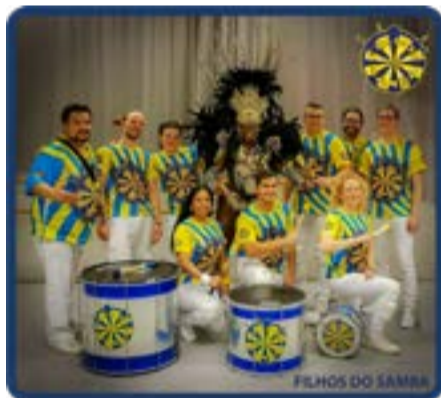
FILHOS DO SAMBA - Samba Trumorkester med Sambadansös/Lady underhåller på strategiska ställen nära centrum/varvning.

Ny stolt huvudsponsor ORCA entreprenad ab