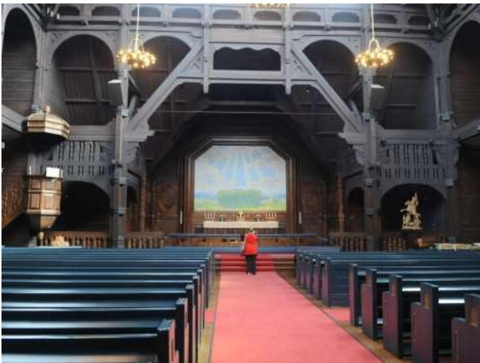
Kiruna kapell 30/8 1906