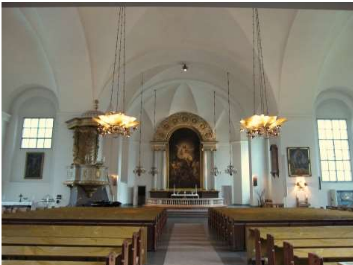
Kungsholms kapell? (kyrka) 4/9 1909