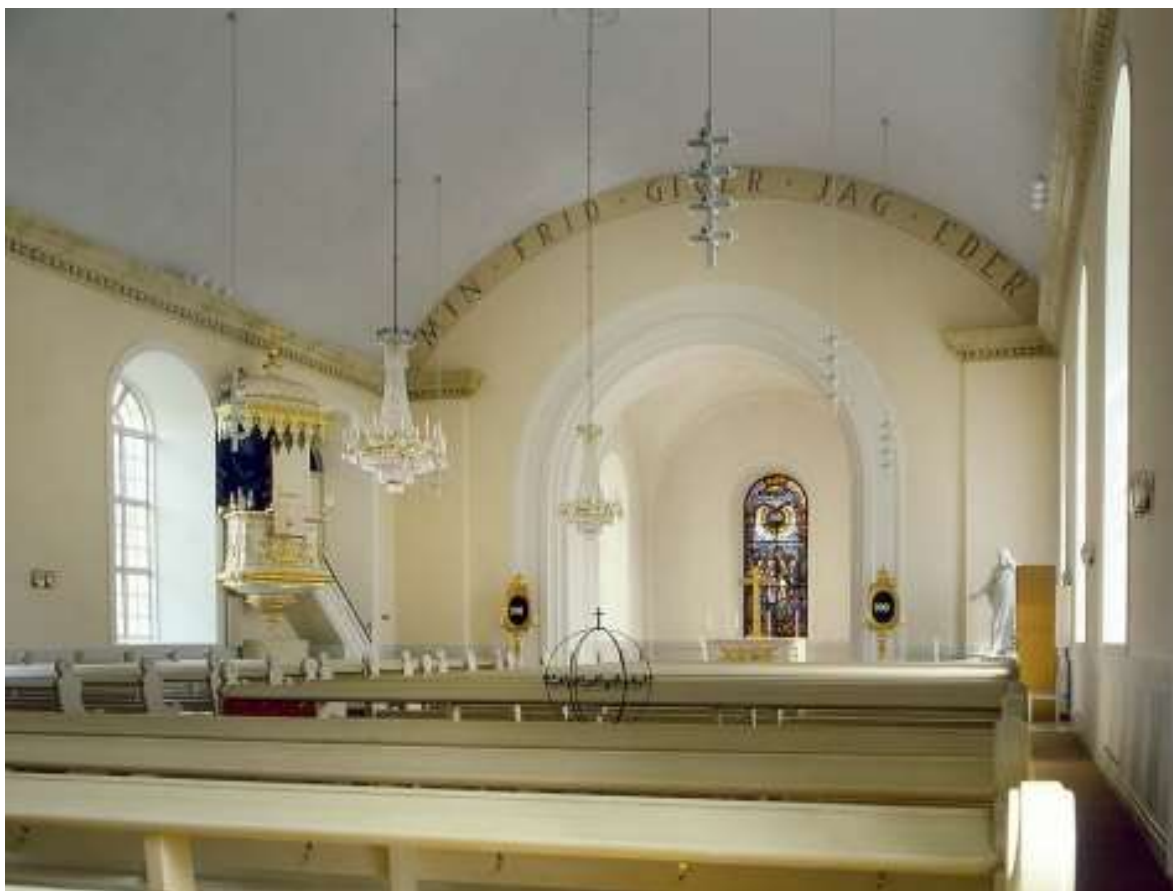
Ytterlännäs kyrka Bollstabruk 5/8 1908