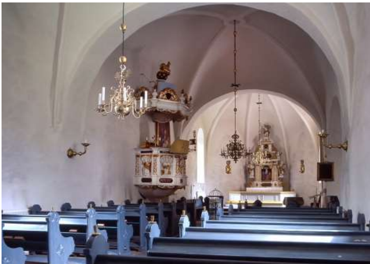
28/9 1909 levererade Tranås Snickerifabrik inredning till Skå kyrka