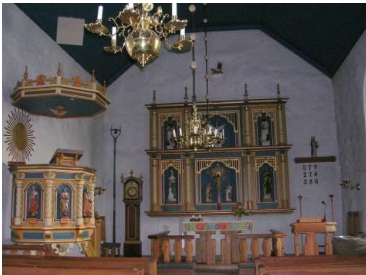
Öjaby kyrka Räppe 1908

10/6 Byggnänt: Gust. Karlsson Öjaby kyrka Räppe Altare, altarskup. Altarring, ljudtak, predikstol och munertoppl. af furu för målning från nyggnänt i kyrkan den i Sept 08. 20 Km baten