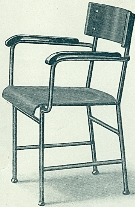
Fåtölj n:r 1076.

AKTIEBOLAGET A. W. NILSSONS FABRIKER M A L M Ö