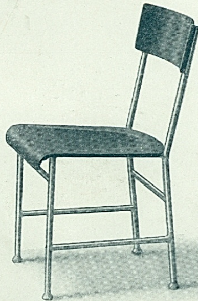
Stol n:r 1075.

Höjd ..... 780 mm. Bredd ..... 580 „ Djup ..... 510 „ Sitshöjd ..... 440 „ Sitsstorlek ..... 430×430 „ Höjd till armstöden .. 650 „ Vikt c:a ..... 7 kg.