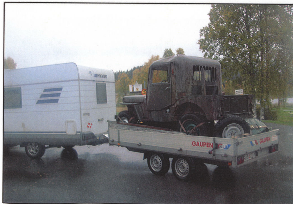
Ekipaget med fyndet tar en stunds rast längs de ändlösa vägsträckorna i Norrland.