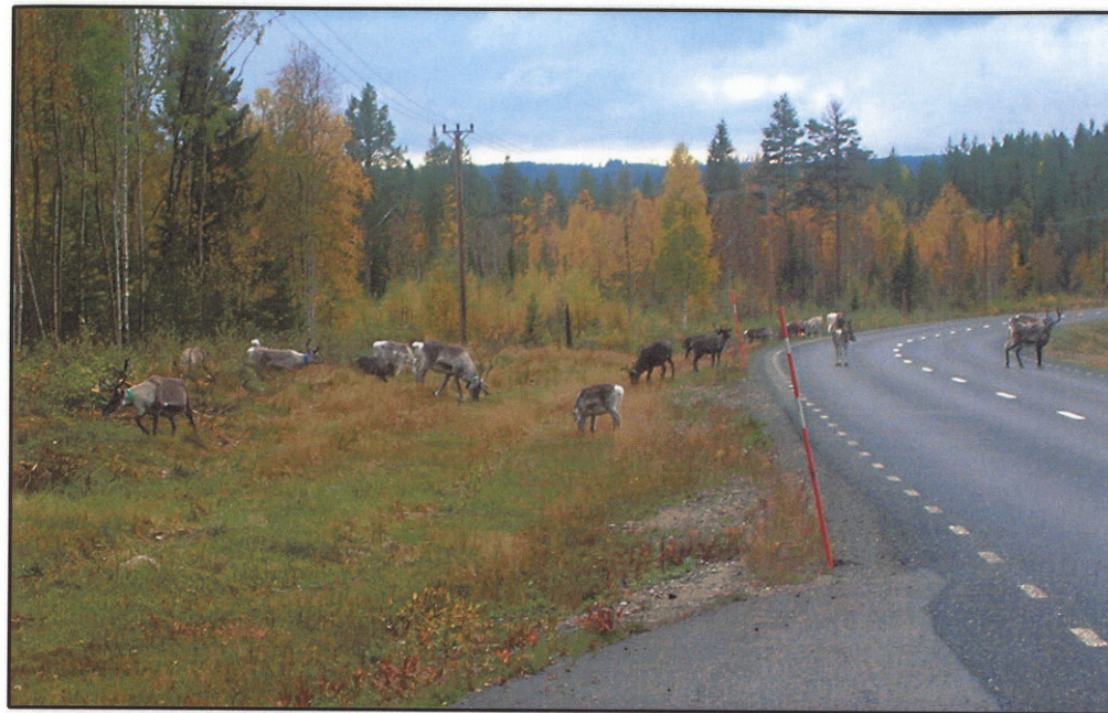
Dåligt trafikvett präglar de norrländska renarna. De vägrar envist att flytta på sig.