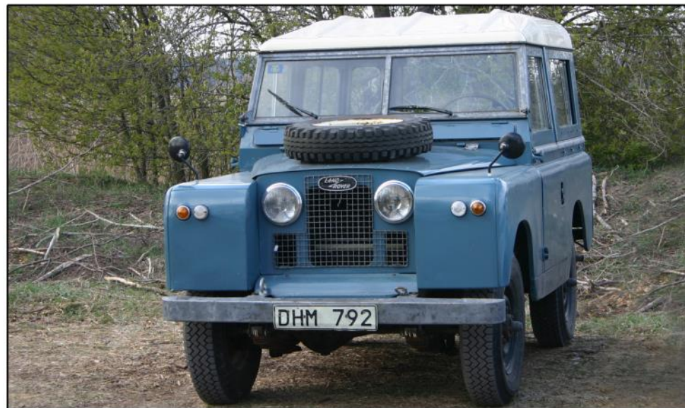
Hem kom den, Land Rover. Skam vore väl om det bara hade varit och vrida om nyckeln och köra hem den. Då hade den här artikeln aldrig blivit av.

Många i föreningen har nog sett den blå Land Rover jag kommer med ibland (Serie II -61). Den inköptes i Göteborg för femton år sedan och skulle så klart köras hem. Den var i fullt körbart skick utlovades det, så jag gav mig glatt iväg med bilen full av extradelar, pickuptak, reservhjul och diverse annat.