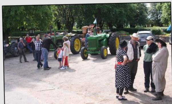
Traktorrally i Österåker.