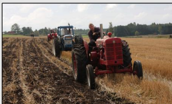
Full fart på gärdet i Valsta vid höstplöjningen