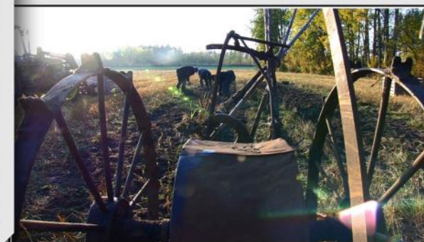
Potatis av god kvalitet skördas med gammal teknik.