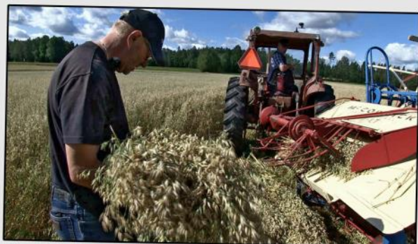
Bra kvalitet på havren till årets julkärvar.