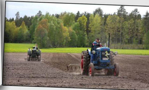
Vårbruk vid Bönerud i Länäs.