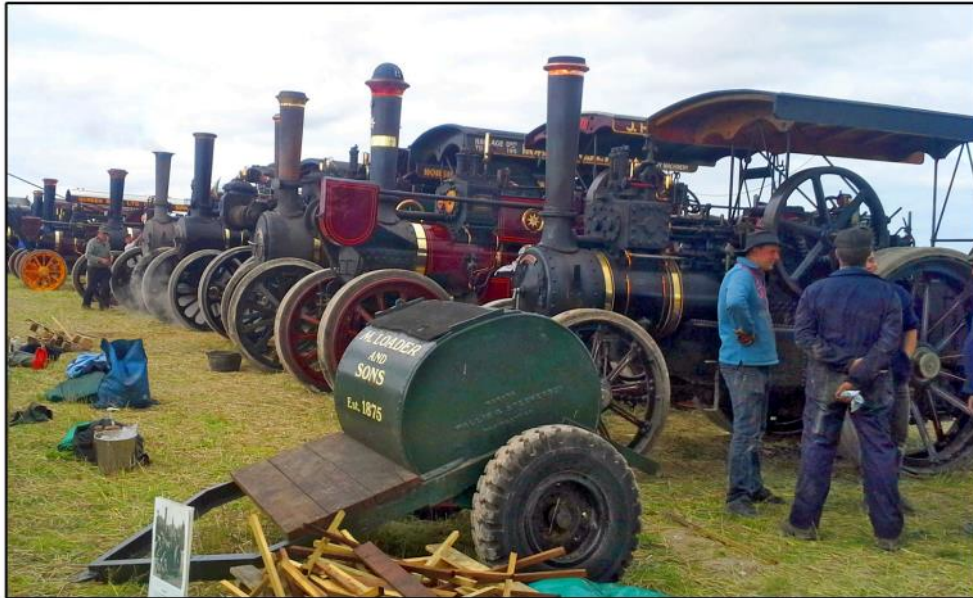
Engelsmännen har en sällsynt förmåga att hålla liv i gamla ångdrivna lokomotorer. En mäktig rad.

En tidig september morgon på Skavsta flygplats med ösregn gick vi på planet till London. En uppskattad present från arbetsgivare och jobbarkompisar efter 40 års anställning på Claestorp säteri utanför Katrineholm. Väl framme blev det buss och tåg till hotellet i Salisbury. Nästa morgon tog vi bussen till Tarrant Hilton Great Dorset Steam Fair, en av Europas största veteranmaskinställning. Vi visste att det var stort men det var mycket större än vi trodde. Ett cirka 300 hektar stort område skulle vi gå över på två dagar.