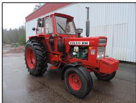
Till slut fick den ett nytt hem, traktorn som stått gömd inne på spikfabriken.