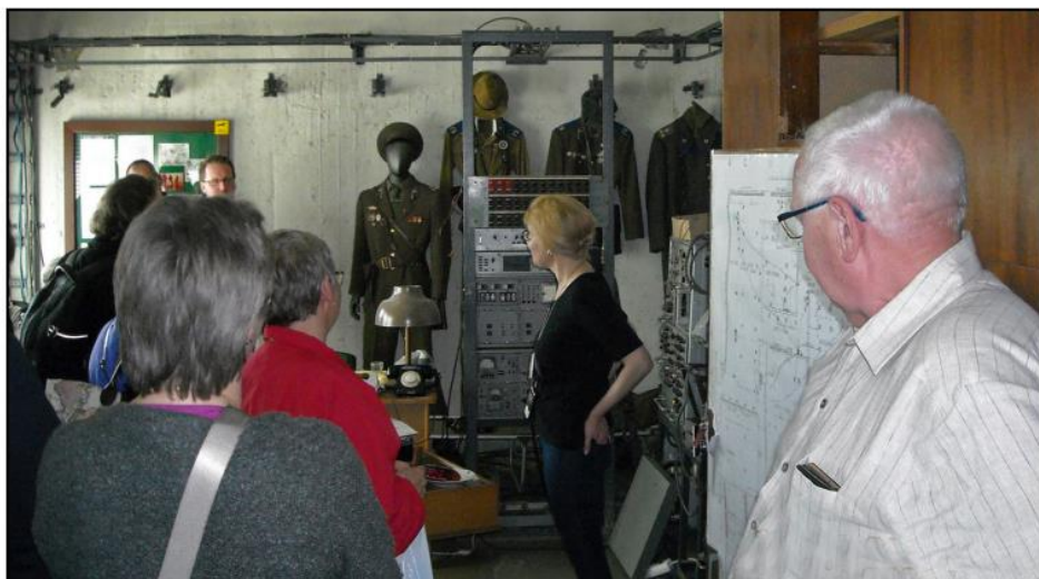
Till och med doften av svett och sura strumpor har man lyckats bevara i det rum som KGB använde för att avlyssna västerlänningar på Viru Hotel. Numera är det museum.