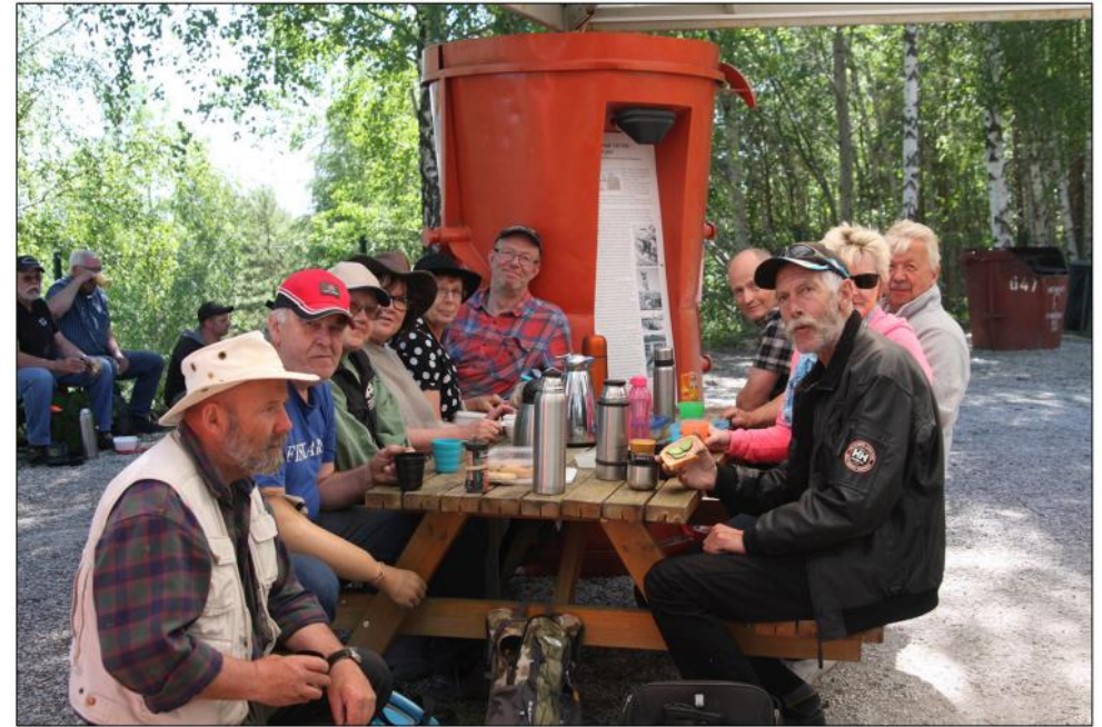
Fikastund i glada vänners lag uppe vid Kalkbrottsutsikten.