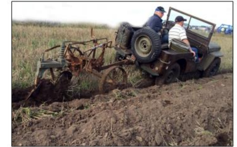
Enskärig bogserad plog efter Jeepen.