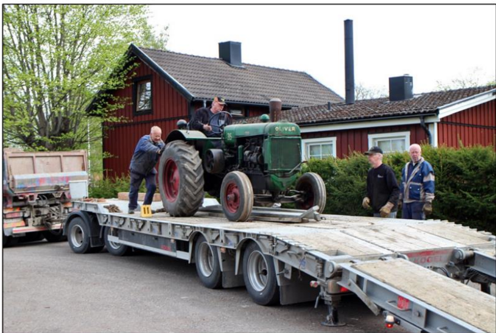
Det krävdes både rejäla fordon och starka muskler för att flytta alla fordon till nya museet.