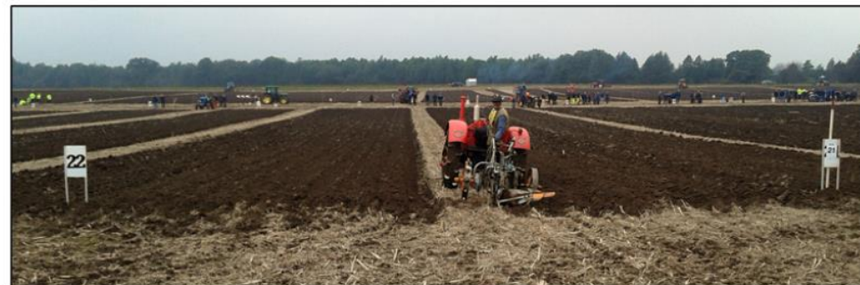
Här gäller det att sikta rätt och mäta väl för att få slutfäran alldeles perfekt.