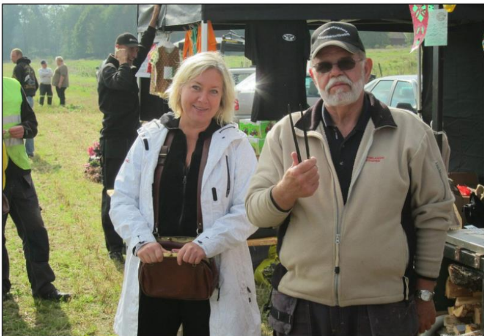
Nasa korv från vedspis är allvarliga saker som synes på säljteamets miner.