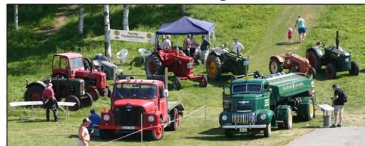
Traditionsenligt medverkade föreningen vid festivalen i Ånnaboda. Arkivbild.

Lördagen den 7 juni hölls traditionsenlig marknad vid Ånnaboda i tidningen Classic Motors regi, ett arrangemang som årligen är förlagt till början av juni. Föreningen var representerad med ett antal traktorer plus en stenkross med stationär motor. Hjelmarebygdens veterantraktorförening stod även för en del försäljning genom vår förnämliga traktorbutik samt transporten mellan parkeringen och marknadsplatsen. Sannolikt var transporttjänsten mycket uppskattad hos publiken med tanke på att parkeringen är belägen flera hundra meter från utställningen med en lång brant backe som