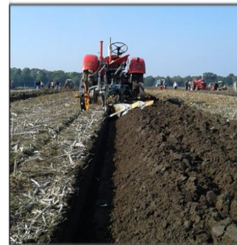
Även en gammal traktor behöver vila en stund.