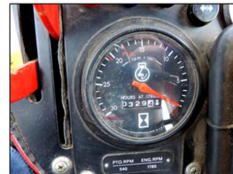
Nej, mätaren ljugar inte. Endast 330 timmar har den här Volvotraktorn gjort tjänst. Skicket är som om den just har kommit ut från fabriken i Eskilstuna.

Oavsett vad man tycker om att traktorn försvann utomlands blev nog lösningen den allra bästa. Det unika med 700:an är just det låga timtalet och nyskicket. Konkret är den ju inte längre en traktor utan mer ett utställningsföremål.