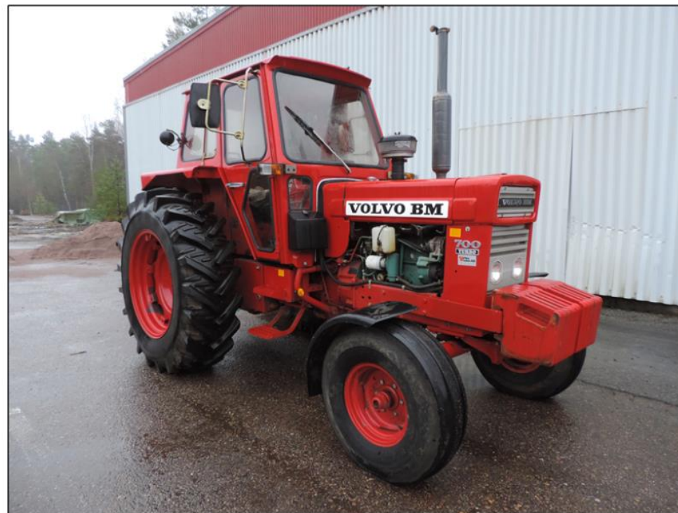
Efter att knappt varit använd sedan 1980 blev den unika Volvotraktorn till salu.

Lite annorlunda motormuller än vad föreningens medlemmar brukar bjuda på hördes lördagen den 13 oktober i västra Närke. Då arrangerade Small Single MC ett veteranmopedrally med start och mål vid Hampetorps camping. Fem mil på bitvis rejält geggiga vägar fick deltagarna stå ut med längs resan. Som delmål i rallyt ingick ett besök vid föreningens museum i Stora Mellösa. Totalt 104 mer eller mindre skitiga mopedister dundrade in på gården för en stunds fika och rundvandring bland gamla traktorer och redskap. Och intresset för grejor med lite grövre kubik var det inget fel på. Det märkets inte minst på alla frågor som ställdes.