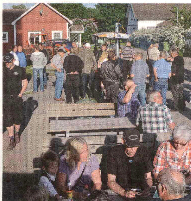
Veterantraktorföreningen sålde hamburgare och kaffe vid invigningen.