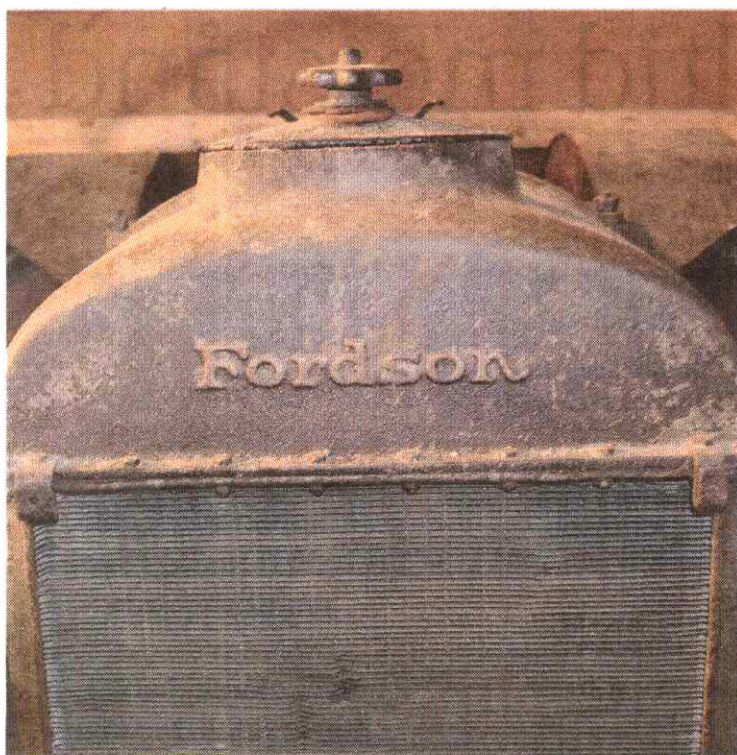
Den här Fordsontraktorn har bara sex år kvar till 100. Den är av årsmodell 1919.