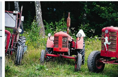
Redo för avfärd. Himlen är full av mörka moln och luften är kvav men stämningen är på topp och medlemmarna i föreningen hävdar att "Det finns inget dåligt väder när man åker traktor".