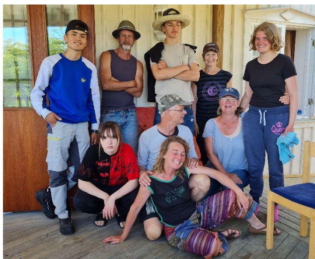
Fabriken första verksamhetsår innehåll får, graffiti, design av fårhus, hantverk, utflykter, snickeri och fika. Under året deltog totalt 9 ungdomar, kortare eller längre.