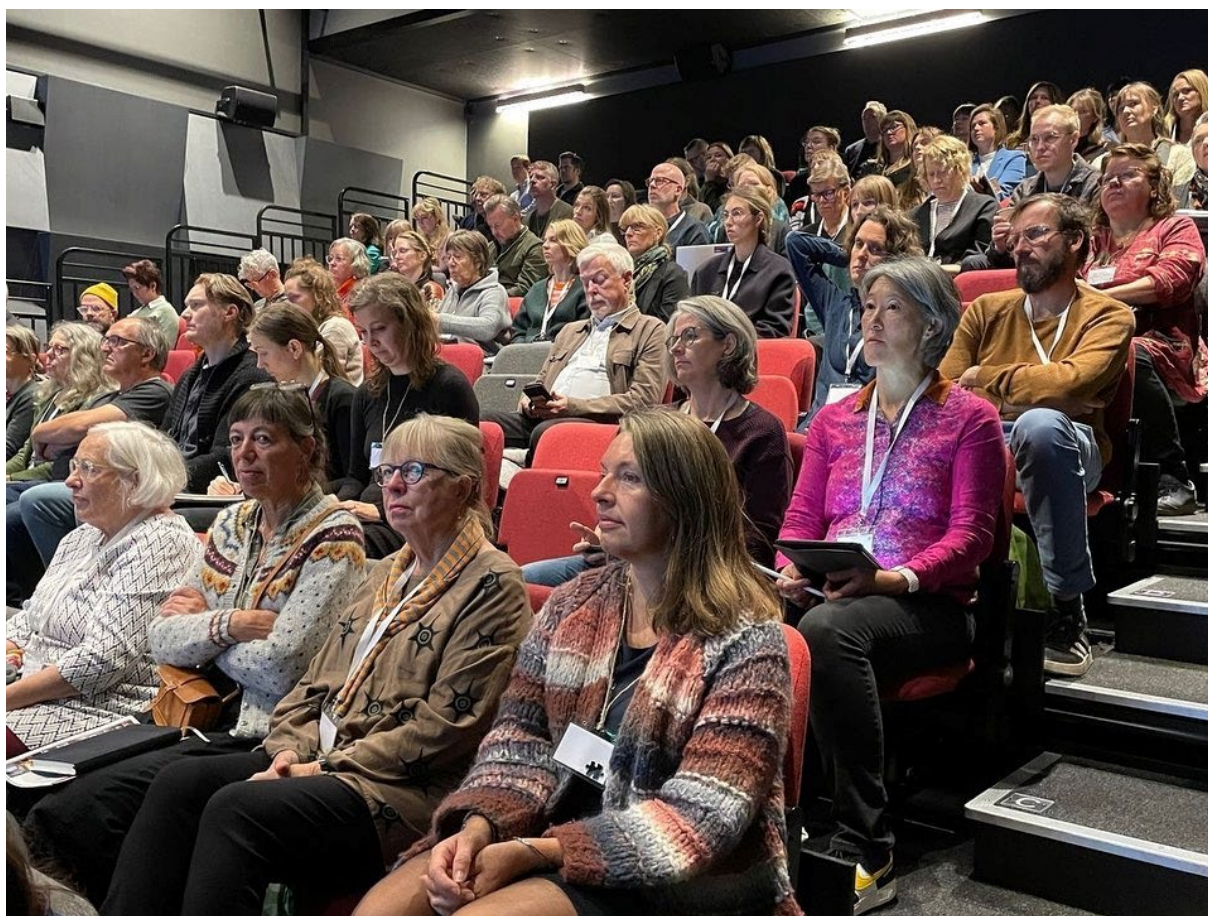
Bild från konferensen "Idéburet och socialt byggande" i Bergsjön 2023, som lockade