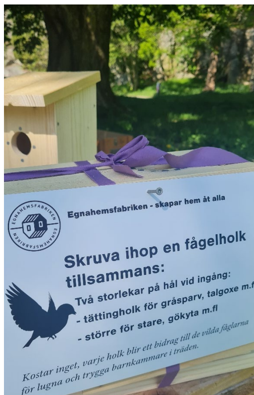
Under Iver-dagen på Sundsby medverkade Fabriken med att bygga fågelholkar tillsammans med familjer.