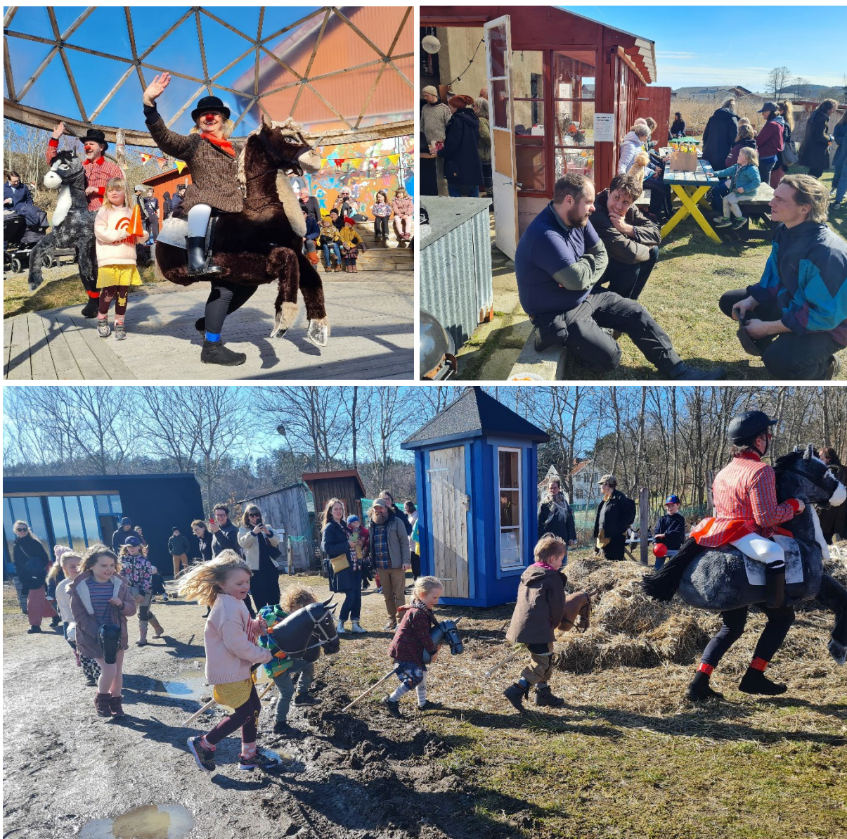
Påskmarknaden blev succé även andra året, Kommunen bidrog med teaterföreställningen Ryttareliten, som uppskattades.