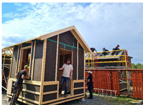
Överst till vänster: Bygga på plats av moduler till Grönsakstorget i Göteborg. Till höger: Stolpverksbygge till Brunnsbo. Nedan till vänster: Gemensamhetshuset som byggs av kursdeltagare. Tillsammans bygger vi. Till höger: Själobbyggarkursen.