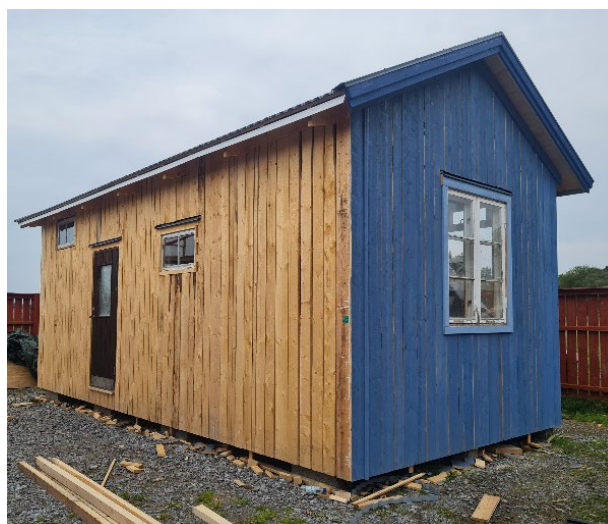
Två blåtonade hus från 2023.. Sofias lilla klarblå på hjul "Snigelhuset", och Loves lite större, av stor andel återbruk.