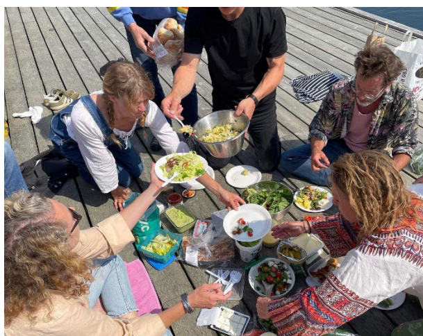
Utveckling Tillsammans arrangerades i april på Nordiska Akvarellmuseet, med workshop och mat på bryggan.

Vi märker att Egnahemsfabriken uppfattas som en unik plats där man känner sig välkommen, sedd och inkluderad. En plats som undersöker hur vi tillsammans kan agera och möta samhällsutmaningar och gjuta handlingskraft och hopp. Hur vi tillsammans kan utveckla samhällsformandet in i en hållbar framtid, baserat på innovation, nyfikenhet, omsorg och solidaritet med världen, naturen och varandra.