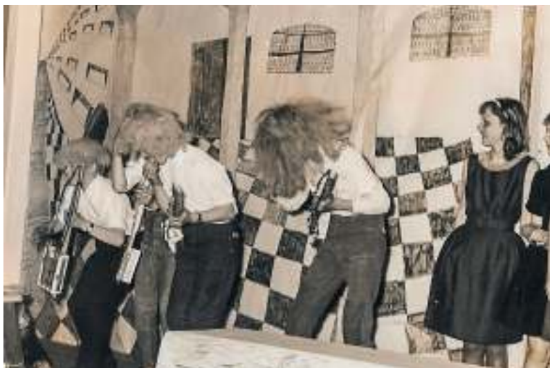
The Beatles dukker op i Svinedrengen. Forfatteren som sufflør under plinten (1964).

Der var ikke de helt store tilbud til børn og unge i Rødding. Idrætsforeningen tilbød fodbold, håndbold, gymnastik og badminton, og Rødding KFUM tilbød håndbold og bordtennis. Der var et ganske tydeligt skel mellem missionsfolkene og de mere sekulære i Rødding, som bl.a. kom til udtryk ved, at KFUM'erne cyklede ned til deres håndboldbane i Sødal Skov, mens de andre brugte stadion. Det skel blev udvisket efterhånden. Jeg tror, at etableringen af en KFUM-spejdergruppe og en ungdomsklub