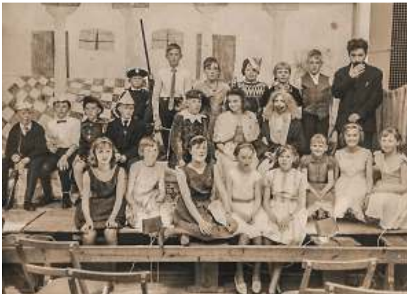
Skolekomedie i forsamlingshuset (1964).

det var nye tider i de to sogne. I øvrigt gik man stadigvæk i skole også om lørdagen, hvad der nok vil overraske en og anden, og en lærer dengang havde betydeligt flere undervisningstimer end en folkeskolelærer har i dag, er jeg ret sikker på.