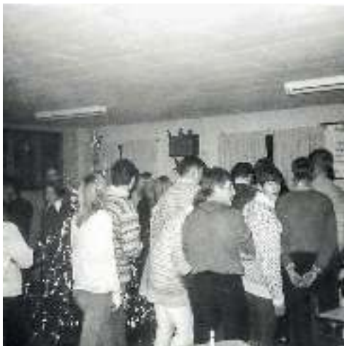
Juleafslutning i Rødding Ungdomsklub (1969)

større og større. En nær ven, en græskkatolsk munk af russisk afstamning, der pludselig havde slået sig ned i et ensomt beliggende hus uden for Rødding, bestyrkede mig i, at jeg ikke skulle blive hængende der resten af livet. Jeg skulle begynde at studere teologi, mente han. Sammen med ham fik jeg stablet en alternativ gudstjeneste på benene i Rødding Kirke. Som medvirkende havde jeg et lille kor af børn fra Rødding Skole og skrev