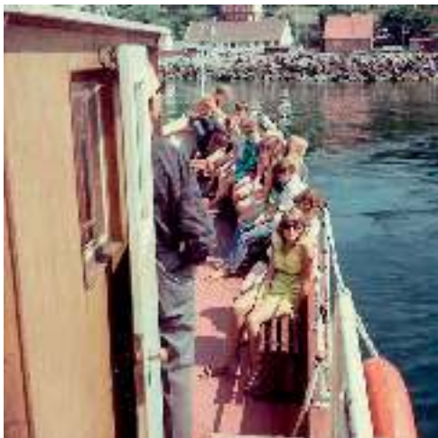
6. og 7. klasse på vej til Christiansø (1969).

men fik så at vide, at der nødvendigvis også skulle en kvindelig lærer med, så det lod sig ikke gøre. Men han lod sig ikke afskrække. Han kendte en sød pige i Viborg, og hun ville gerne tage med. Og sådan blev det. Han og pigen fra Viborg drog afsted med Løvel Skoles ældste elever. Det bandede vejen for mig, for når Løvel kunne, så ville Rødding ikke stå tilbage, og jeg fik endda en kvindelig lærervikar med, da Rødding Skoles ældste