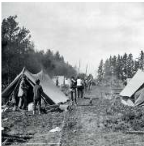
Røddingspejderne på lejr i Sødal Skov (1968).