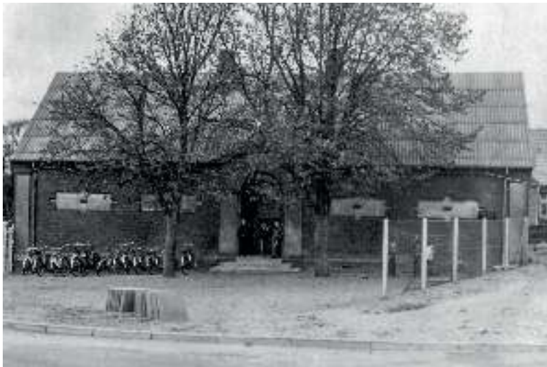
Rødding Skole som den så ud til 1967 (ca. 1900).