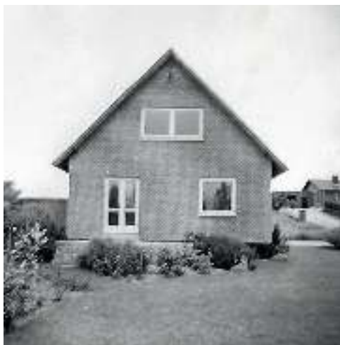
Røddings nyeste lærerbolig (1964)

Skolegangen gik i gang næste morgen. Fadervor og en salme markerede naturligvis skoledagens begyndelse. Der var, så vidt jeg husker, kun 70 elever, og skolen havde tre lærere: Førstelæreren, en småbørnslærerinde og mig. Det var en 4-klasse skole. 1.klasse gik for sig selv, 2. og 3. klasse gik sammen og kaldtes "Bette