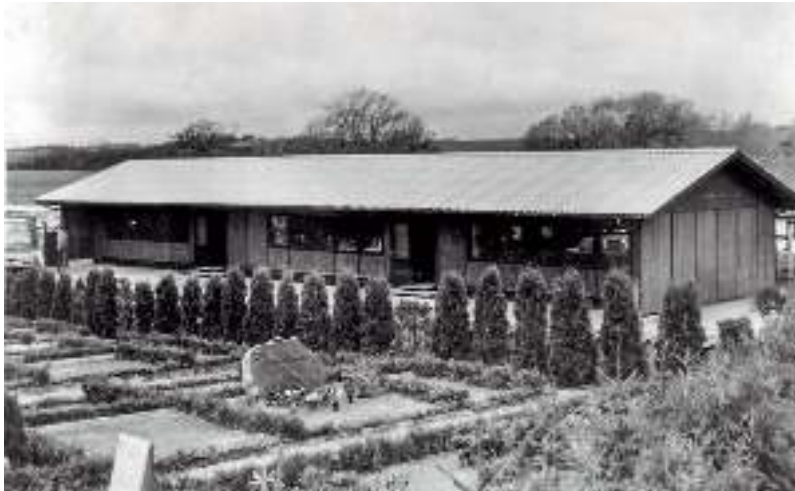
En af de nye barakker.

det var nye tider i de to sogne. I øvrigt gik man stadigvæk i skole også om lørdagen, hvad der nok vil overraske en og anden, og en lærer dengang havde betydeligt flere undervisningstimer end en folkeskolelærer har i dag, er jeg ret sikker på.