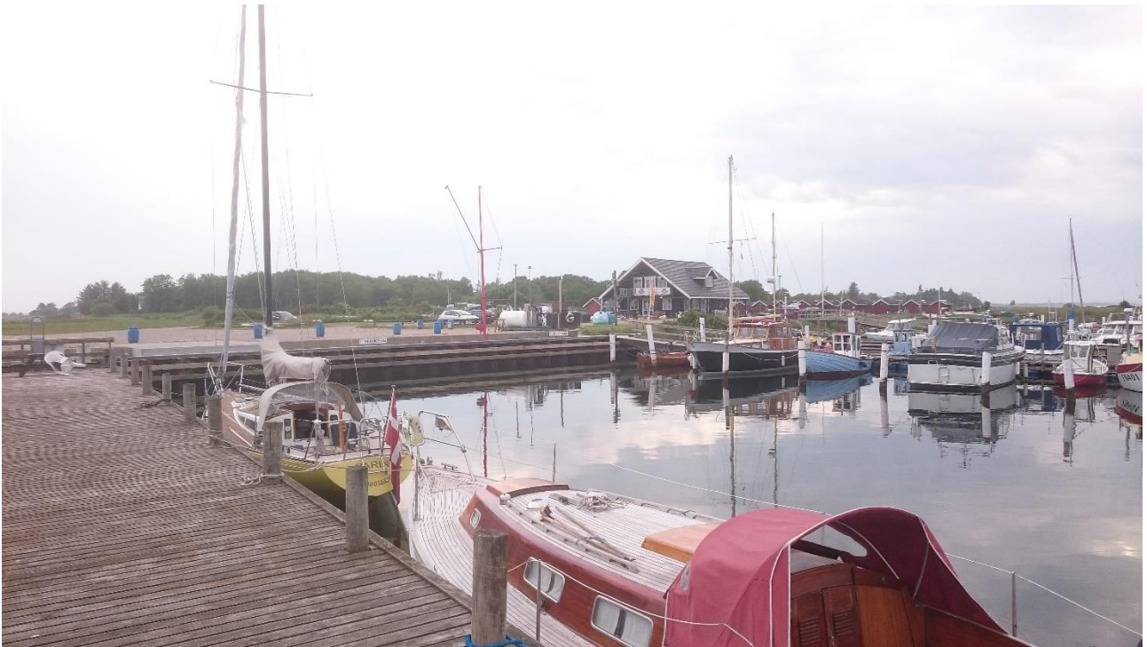
Egense havn – rolig havn.