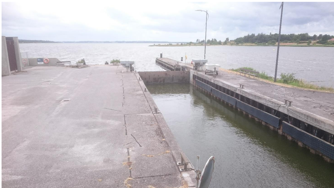
Slusen til Hjarbæk Fjord, set mod syd. – Fast bemandede med en slusevagt. Loppetjans eller kedeligt, vælg selv.

Og det er rigtigt, vi så flere sæler i området ved havnen.