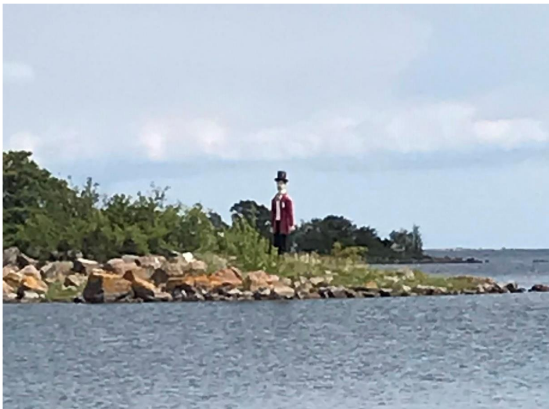
”Red Old Man”

4.7. er vinden syd og vi har besluttet ikke at tage længere nord på, for at være sikker på at nå træffet hos Walsted på Thurø. Vi havde dog ca en måned til det, så mon ikke det kunne nås. – Men vi gider ikke skynde os, så vi bliver i Påskallavik og vil afvente de vestlige vinde, der er lovet de nærmeste dage.