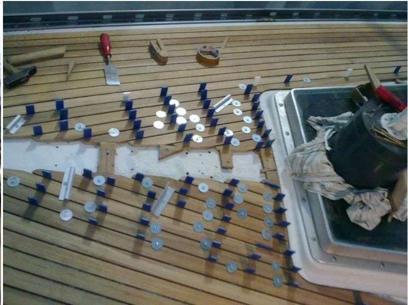
Limning af de sidste stave inden fisken som det sidste blev tilpasset og monteret.