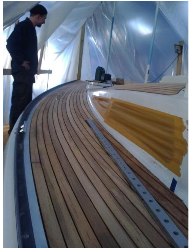
.... og her begynder det at tage form, så man kan ane hvor smukt det færdige resultat bliver.