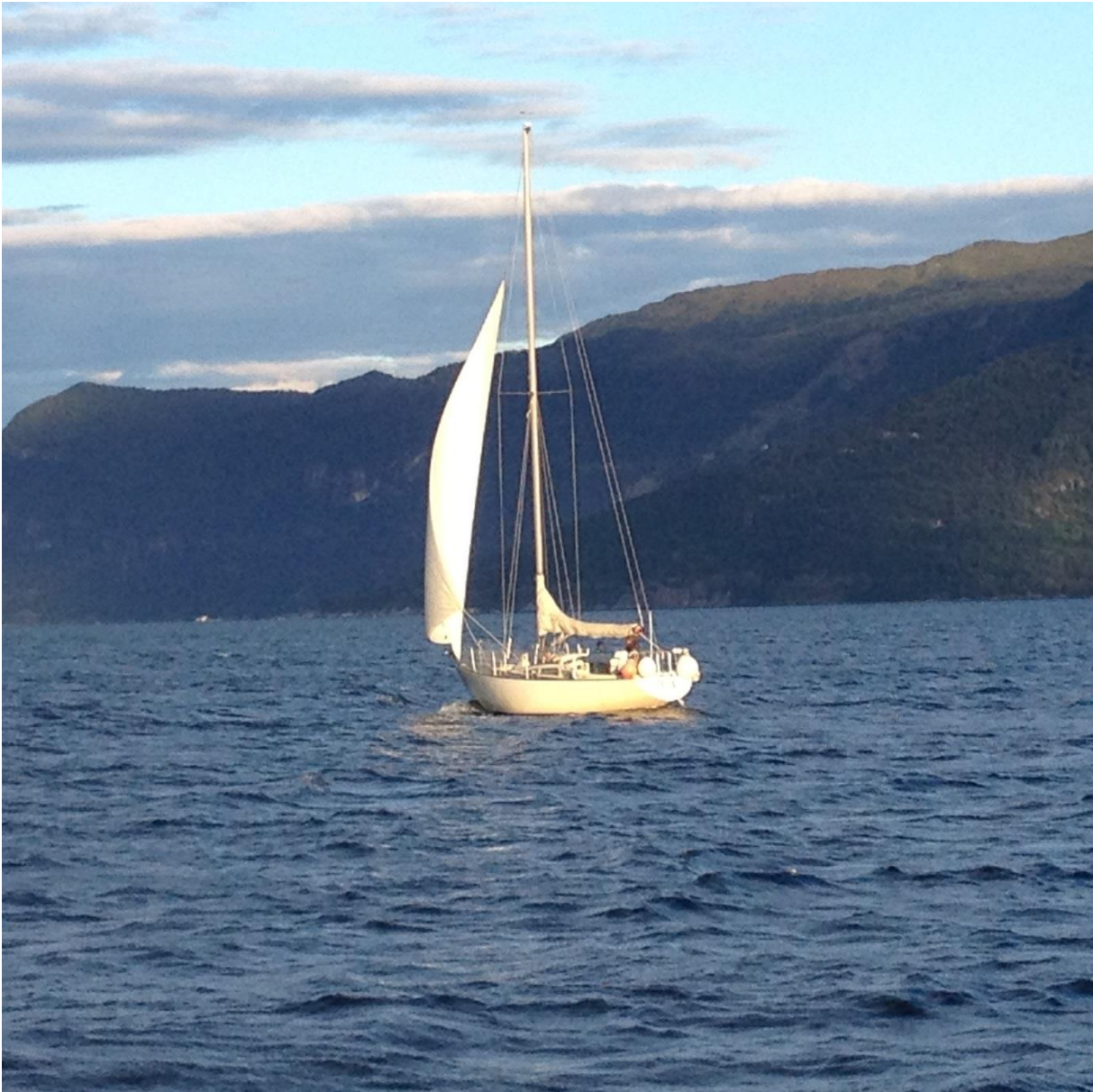
Shanty 2 ved soloppgang ved Utne i Hardangerfjorden. August 2016.