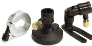
Tilbehør for Drill stands