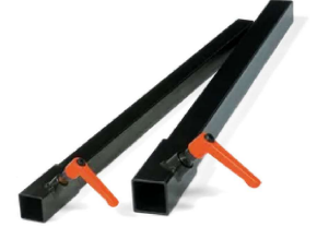
Tilbehør for Drill stands