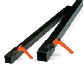
Tilbehør for Drill stands