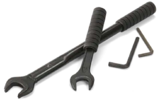
Tilbehør for Drill stands