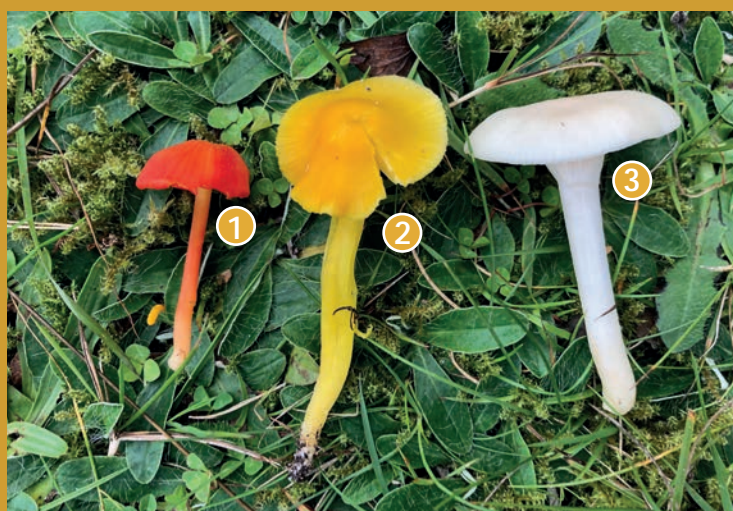
1. Mönjevaxskivling 2. Spröd vaxskivling 3. Vit vaxskivling

Björkensdals öppna betesmarker är artrika miljöer. Kommer du hit på sommaren kan du få se många olika blommor och insekter. När de flesta växter är överblommade dyker det upp nya färggranna saker i de betade markerna. Det är olika vaxskivlingar i rött, gult, orange, grönt och vitt. Vissa av dem är sällsynta och finns bara i marker som betats under lång tid.