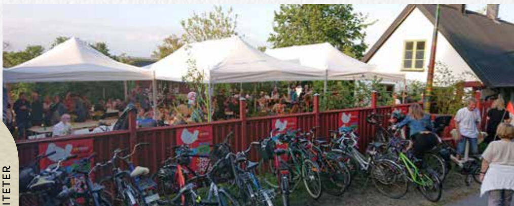
Fest på Tolvan för hela byn.