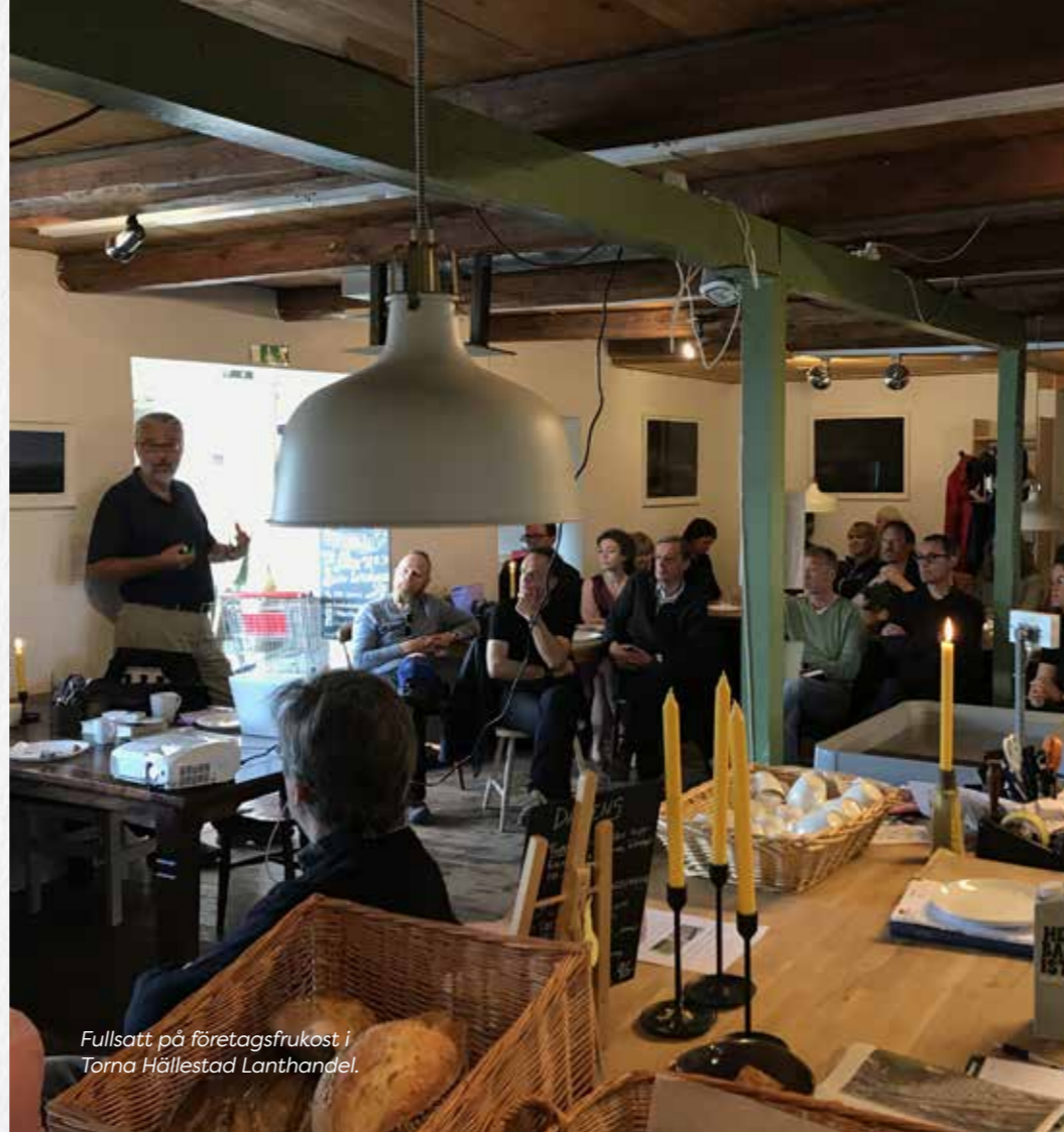
Fullsatt på företagsfrukost i Torna Hällestad Lanthandel.

Det finns även en önskan om fasta och/eller mobila kontorsplatser.