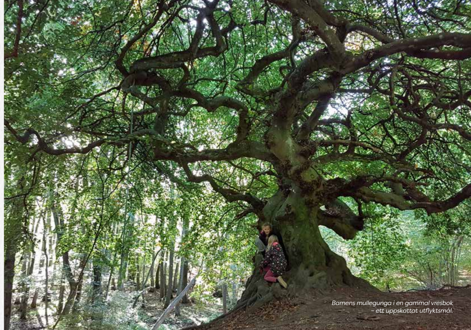
Barnens mullegunga i en gammal vresbok – ett uppskattat utflyktsmål.