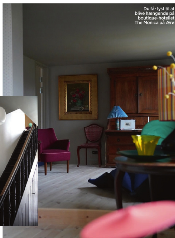
Du får lyst til at blive hængende på boutique-hotellet The Monica på Ærø