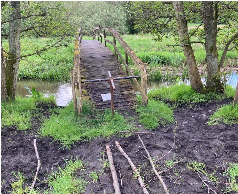
Figur 4 Foto af den sydlige bro. Manglende rigkærsvegetation ved den eksisterende bro.

Hvor broen er placeret i dag, er der en oprådt trampesti på nordsiden af vandløbet og arealet indeholder ingen rigkærsvegetation (se figur 4).