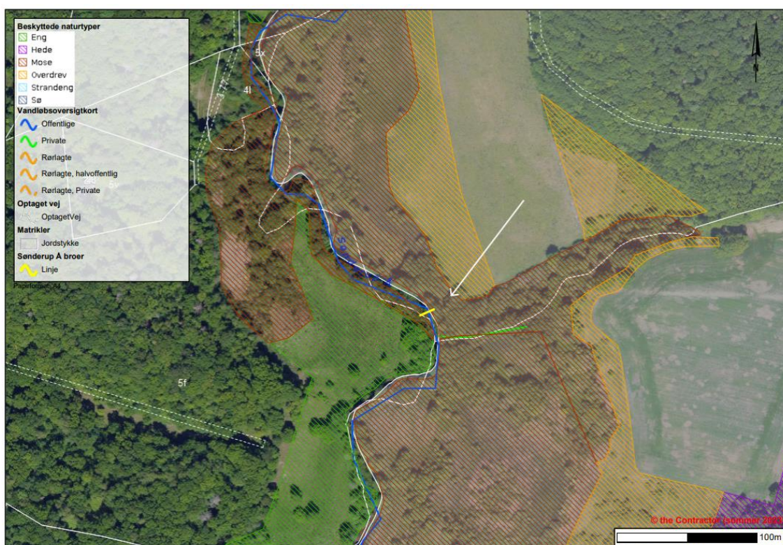
Figur 9 Kort over sydlig bro og §3 registreret natur. Bro markeret med gult.