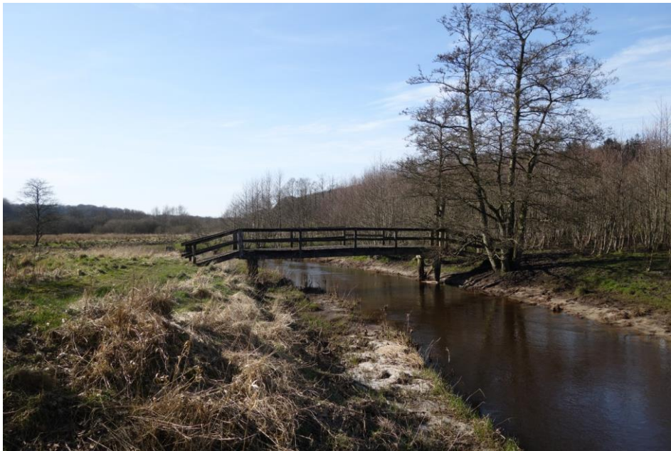
Figur 1 Eksisterende bro nord for Højrisvej. Broen nord for Højrisvej er placeret på matr.nr. 4i Åstrup Gde., Veggerby. Foto taget i 2020.