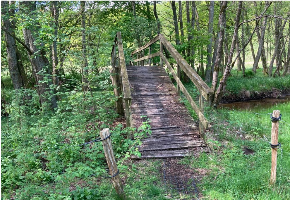
Figur 6 Fravær af urtebræmme ved sydlig bro

Af arter på udpegningsgrundlaget, der kan findes ved åen, er Gul Stenbræk (1528), Bæklampret (1096) og Odder (1355).