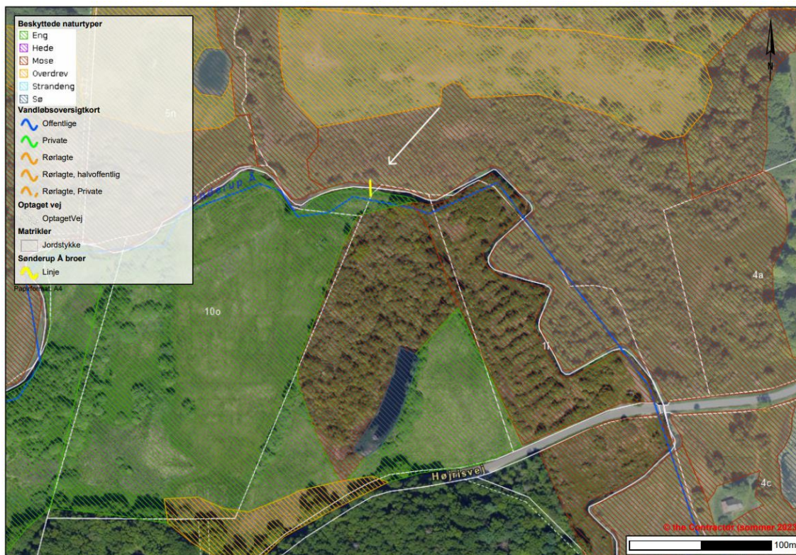
Figur 8 Kort over nordlig bro og §3 registreret natur. Bro markeret med gult.