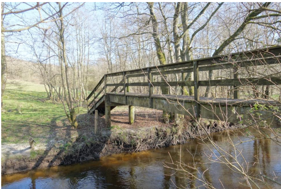
Figur 2 Foto af bro syd for Højrisvej. Broen syd for Højrisvej er placeret på matr.nr. 4k Åstrup Gde., Veggerby. Foto taget i 2020.

De ansøgte broer er 10 meter lange og 2,5 meter bredde. Broerne dimensioneres med en nyttelast på 500kg/m 2 . Konstruktion vil være svagt buet og holdes nært terrænet. Broerne udføres i træ.