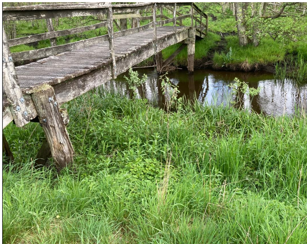
Figur 5 Fin veludviklet urtebræmme ved nordlig bro.

Det vurderes ud fra naturtilstanden på de pågældende steder og den relative størrelse af arealet der inddrages, at udskiftning af broen vil udgøre et ubetydeligt indgreb i den beskyttede urtebræmme.