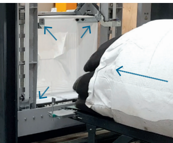
Der Prozess für Haubenstretchverpackungen