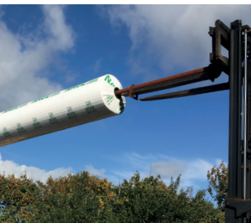
Ein Plug am Ende der Rolle ist optional

Zu den Vorteilen von Haubenstretchverpackungen gehören der geringere Folienverbrauch. Für den Endverbraucher bedeutet dies, dass er entsprechend weniger Abfälle entsorgen muss. Ein geringerer Folienverbrauch sorgt auch für die Reduzierung der gesamten Folienkosten.