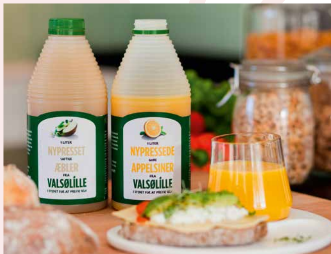
Det mest sælgende Valsølille-produkt er den nypressede appelsinjuice.