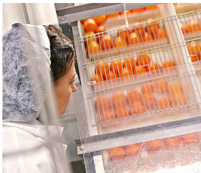
Til en liter Valsøllille-juice går ca. 2,2 kg appelsiner.

Valsøllille ønsker at være kendt for smagfulde, ærlige, naturlige og autentiske frugt- og grøntsagsjuicer.