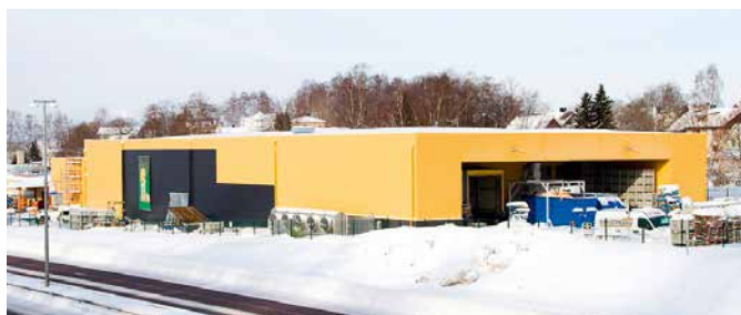
Presseriet i Bråmhult ved Borås, hvor ca. 360 ton citrusfrugter bliver presset hver uge.

Valsøllille Most har i mange år forkælet kræsne danske ganer. Efter at Eckes-Granini har købt Rynkeby, bliver Valsøllilles nypressede juicer og smoothies en del af Rynkeby-familien.