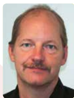
AF STEEN LUND-PEDERSEN

Da Rynkeby i maj blev en del af Eckes-Granini, blev det starten på store ændringer i Rynkebys arbejdsprocesser og systemanvendelse over de næste 1-3 år