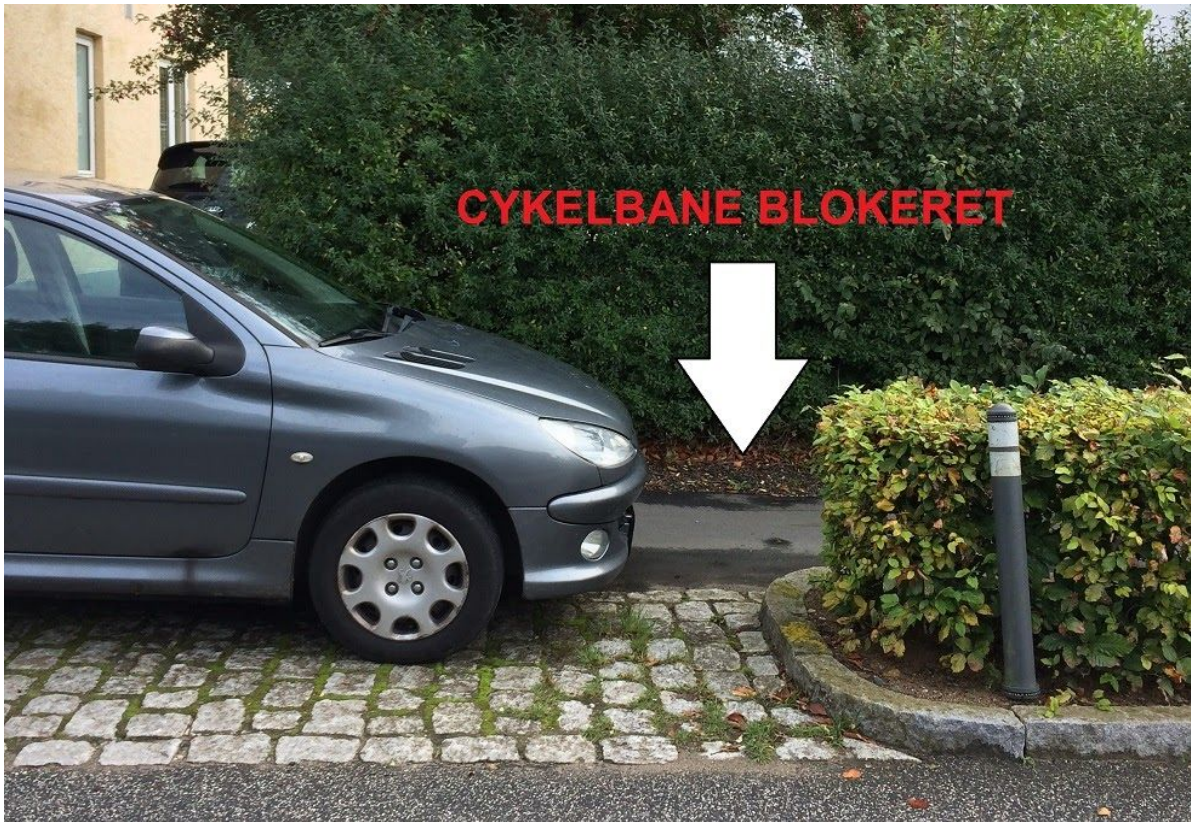
Cykelbane er blokeret