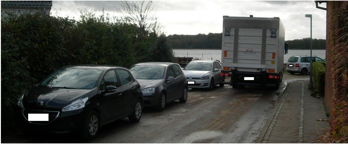
Lastbilen sidder fast