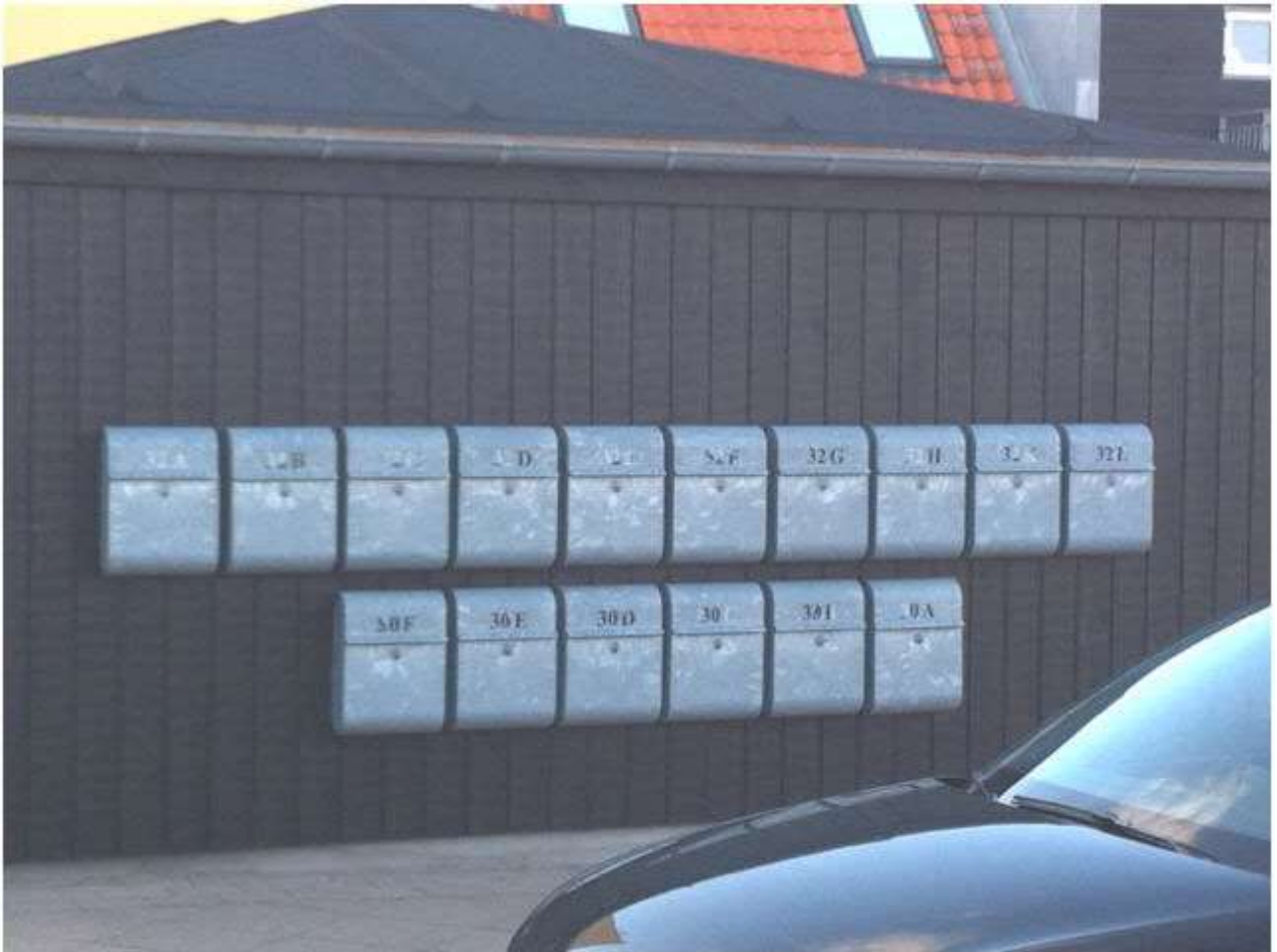
Bilag 2: Fællesanlæg