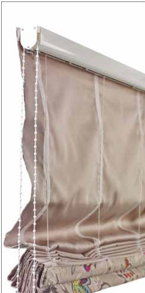
Ändlöst keddrag alt. snördrag