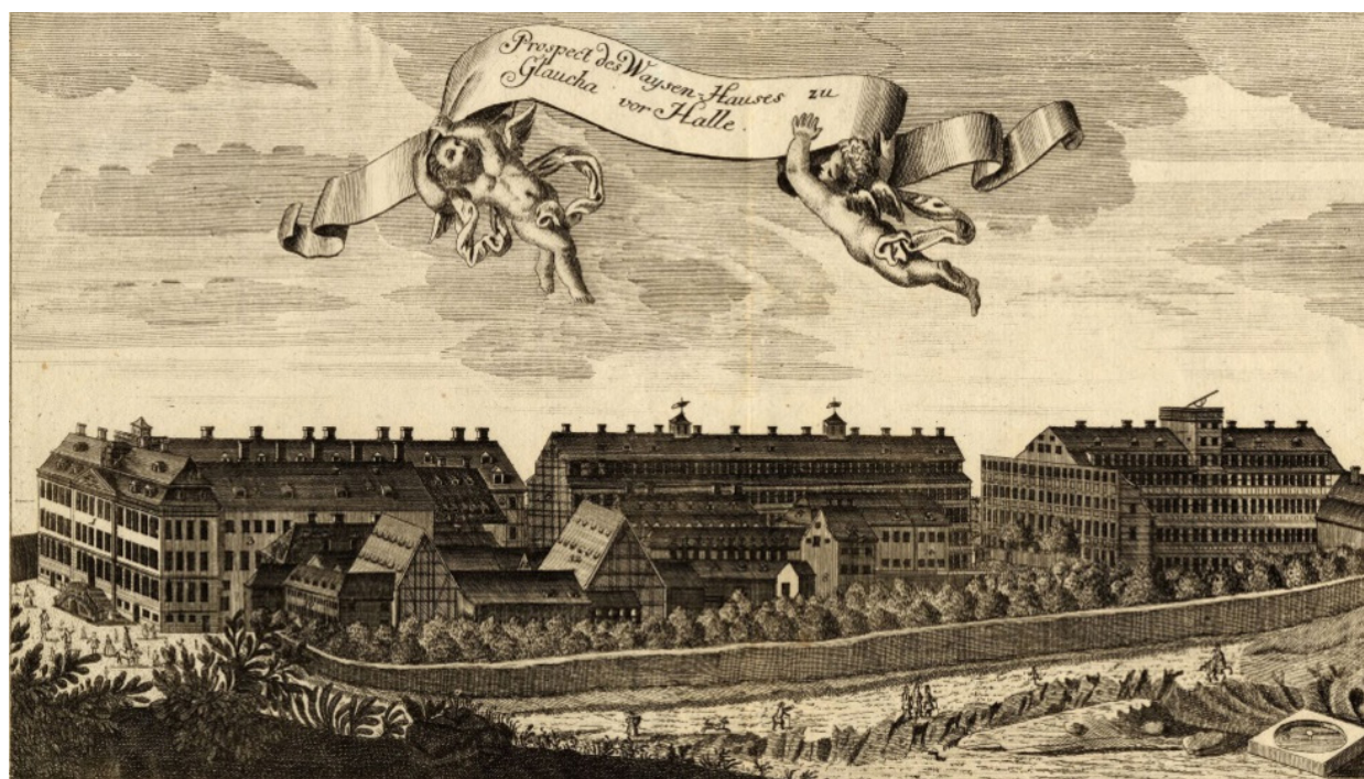
De Franckeska stiftelserna i Halle 1749, kopparstick.

och världen på sikt förändras till det bättre enligt devisen ”Weltveränderung durch Menschensveränderung” 1 (Världsförändring genom människoförändring). Vid Anstalterna fanns barnhem och skolor, och där utbildades manliga pedagoger och lärare. Där fanns en medicinsk klinik och ett omfattande bibliotek. I Halle grundades också en teologisk fakultet, där undervisningen skedde utifrån pietistiska ideal om personlig tro och omvändelse. Syftet med den teologiska utbildningen var att motverka vad dess initiativtagare uppfattade som en inom prästerskapet föreliggande andlig utarmning. Föreställningen om en omformering av samhället skilde