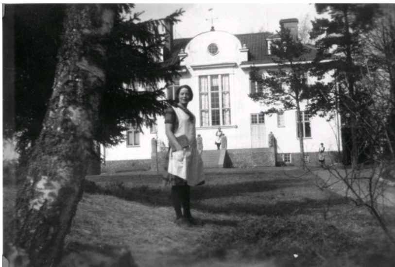
I Viebäck i Småland bedrevs mellan 1905 och 1947 uppfostringsarbete för flickor och kvinnor. Viebäckshemmen bedrevs, på statens uppdrag, av Diakonissanstalten i Stockholm.

Ord och sakrament. Överhetsståndet vakade över kyrkans bevarande, det vill säga Ordets utbredning liksom tukt och ordning. Det tredje ståndet, Hushållsståndet, familjen, fungerade som samhällets grund. Hushållsståndets stabilitet uppfattades vara avgörande för statens sammanhållning. Mellan de tre stånden rådde en inbördes dynamik. Läroståndet intog en särskild plats, som garant för människornas frälsning. Överheten var överordnad undersåtarna, men underordnad läroståndet. Överheten hade ansvar för samhällets och kyrkans fortbestånd. Församlingens lärare var överordnade åhörarna. Hufvudern i hushållet var således underordnad församlingens lärare och överheten men fungerade i sitt hushåll både som överhet och som lärare för de övriga i hushållet; hustru, barn, andra anhöriga och tjänstefolk. Det var hufvaderns ansvar att upprätthålla såväl lekamlig som andlig omsorg om hushållets medlemmar. Individerna utförde sin kallelse och förelagda uppgifter inom det stånd denne var född i, och undersåtarna, åhörarna och husfolket skulle visa lydighet och hörsamhet. Denna samhällssyn, konkret uttryckt i hustavlans ordningar, bevarade på ett effektivt sätt den rådande samhällsordningen.