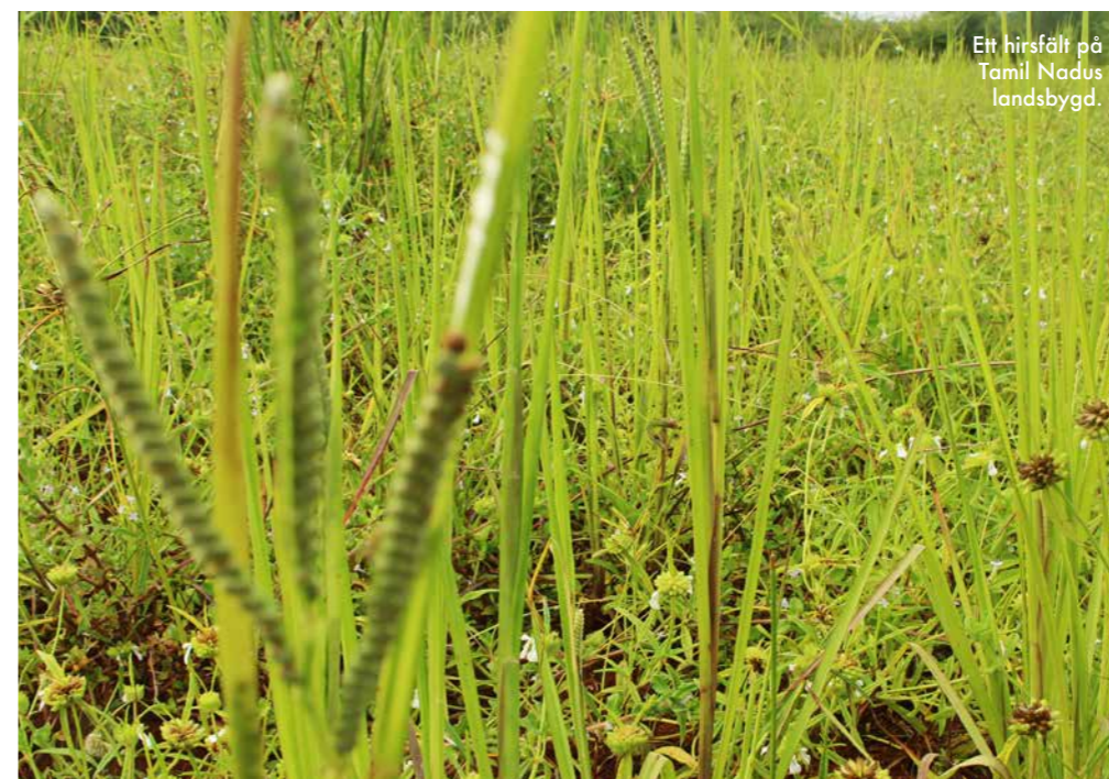
Ett hirsfält på Tamil Nadus landsbygd.