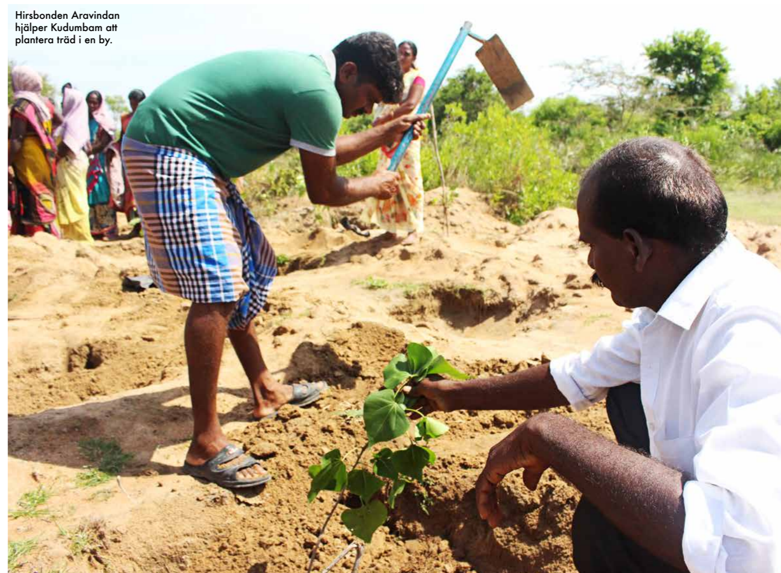
Hirsbonden Aravindan hjälper Kudumbam att plantera träd i en by.

En fördel med hirs är att den naturligt är tolerant mot ett varmare samt torrare klimat. På grund av dessa egenskaper har icke-statliga organisationer som Kudumbam också börjat lyfta fram fördelarna