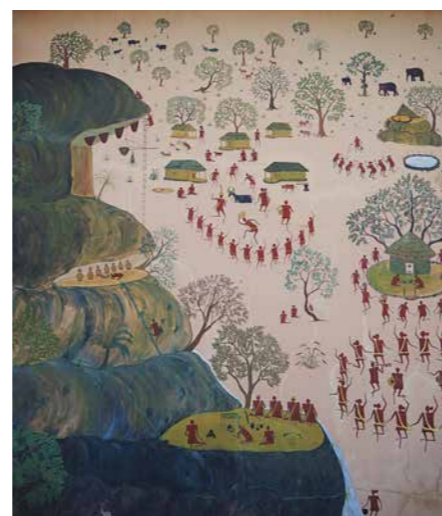
Målning från urfolken.

Barefoot Ecologists-projektet och People & Nature Collectives-programmet, redan ägnat sig åt. I det nya programmet arbetar man med katastrofriskreducering och klimatanpassning, med utgångspunkt i urfolks- och lokalsamhällenas kunskaper och behov. "På Keystone jobbar vi