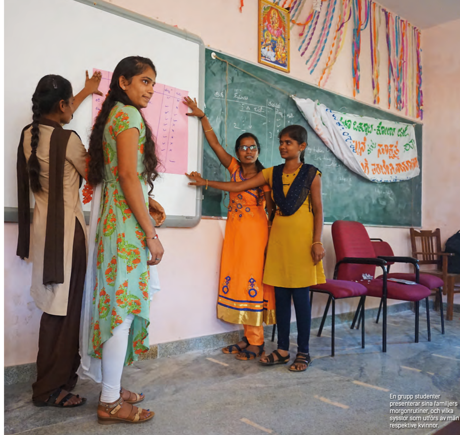
En grupp studenter presenterar sina familjers morgonrutiner, och vilka sysslor som utförs av män respektive kvinnor.

–Vi måste lära barn om jämställdhet, föräldrar behöver vara jämställda så att