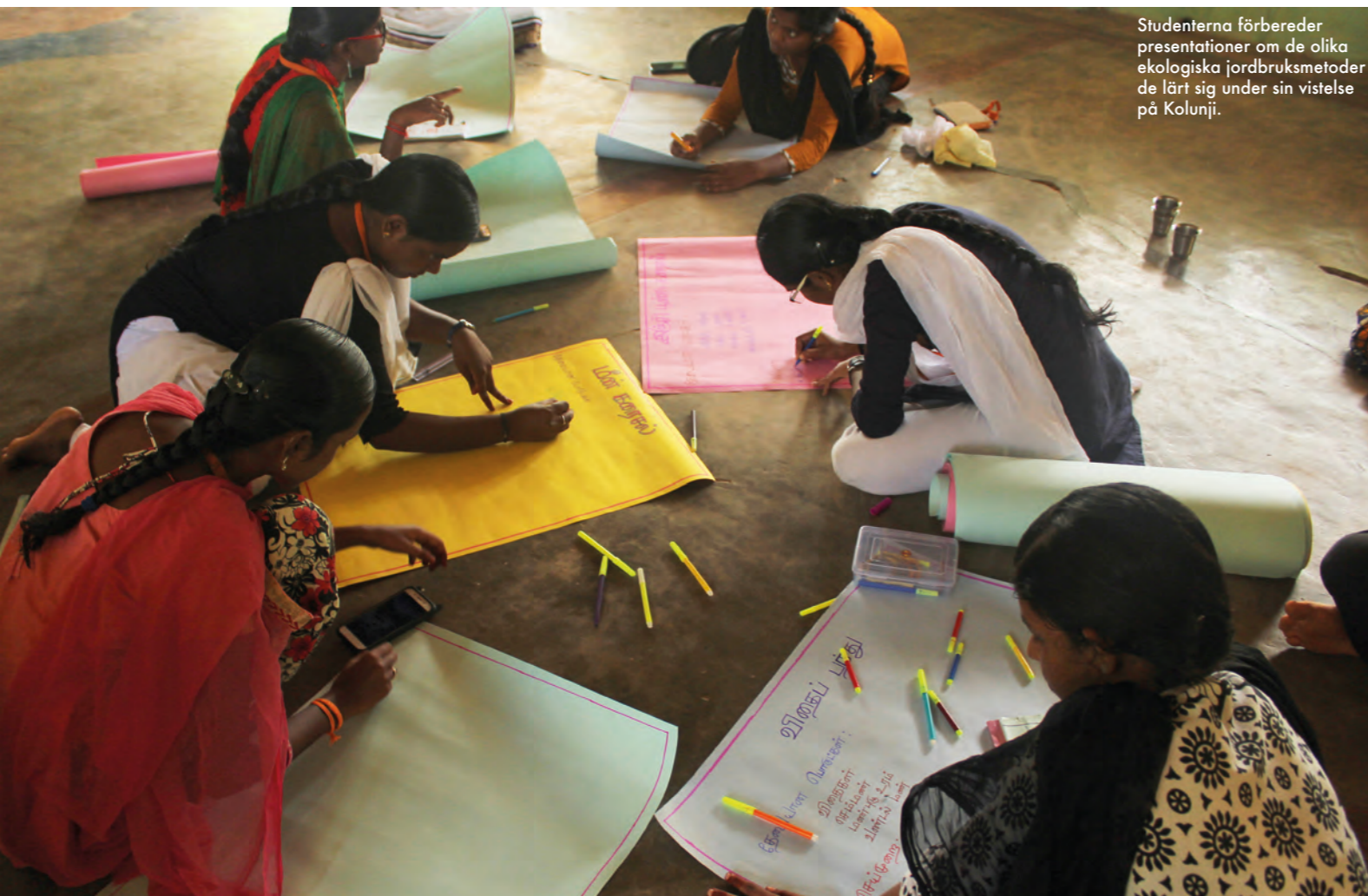
Studenterna förbereder presentationer om de olika ekologiska jordbruksmetoder de lärt sig under sin vistelse på Kolunji.

att plantera träd och att odla torktåliga grödor såsom hirs.