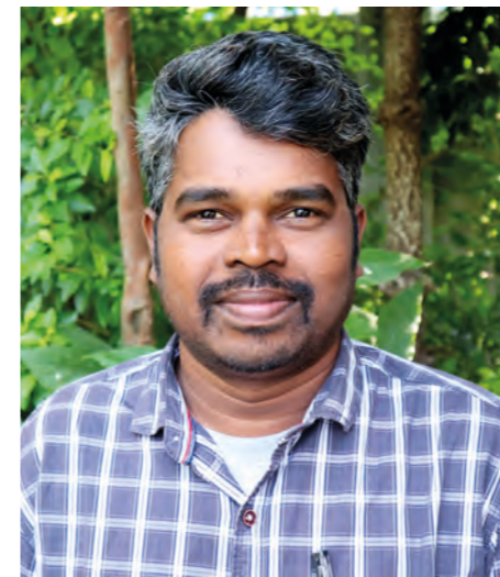
Mahadish från Keystone Foundation.

Naturresurserna i skogen, och framförallt honung är en av få inkomstkällor för urfolken. Denna tradition ses som helig och utövas av ett fåtal män i byarna. Para-