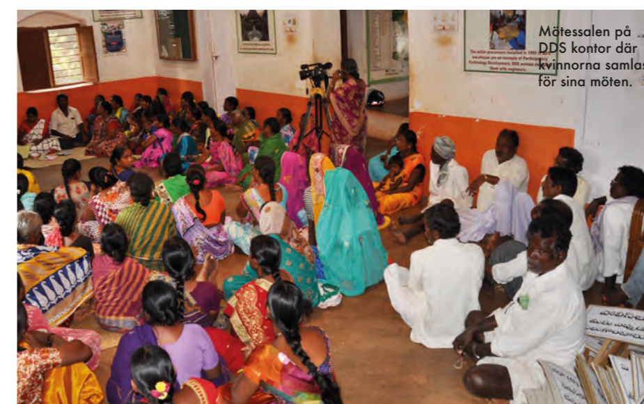
Mötesalen på DDS kontor där kvinnorna samlas för sina möten.

”Allt jag lärt mig tar jag tillbaka till min hemby. Tillsammans med min kompis har jag startat en grupp för att utbilda unga tjejer från närliggande byar.”