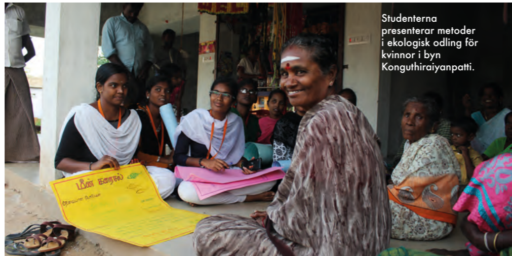
Studenterna presenterar metoder i ekologisk odling för kvinnor i byn Konguthiraiyanpatti.

Därefter diskuteras metoder som är motståndskraftiga vid klimatförändringar. Studenterna betonar att det är viktigt