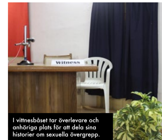
I vittnesbåset tar överlevare och anhöriga plats för att dela sina historier om sexuella övergrepp.

“Även om lagar mot sexuellt våld är starka så är de dåligt implementerade.”