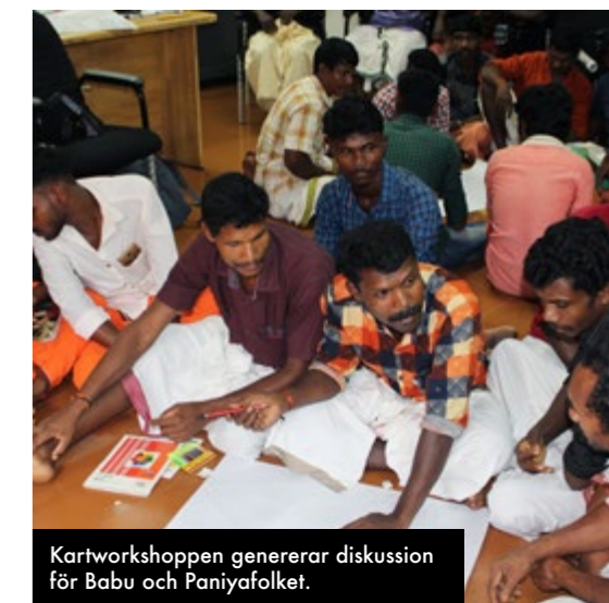
Kartworkshopen genererar diskussion för Babu och Paniyafolket.