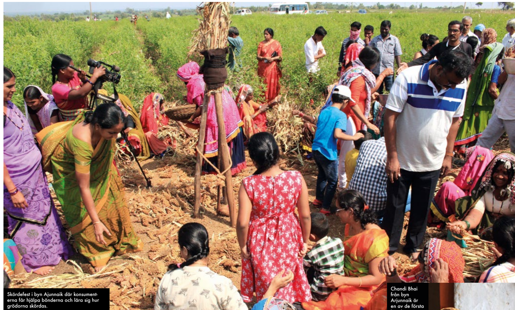
Skördefest i byn Arjunnaik där konsumenterna får hjälpa bönderna och lära sig hur grödorna skördas.

–Det finns idag många barn som inte vet hur odling går till. Genom att följa