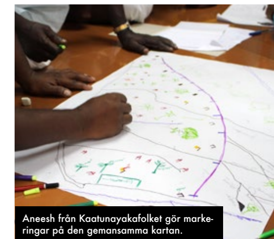
Aneesh från Kaatunayakafolket gör markeringar på den gemensamma karta.