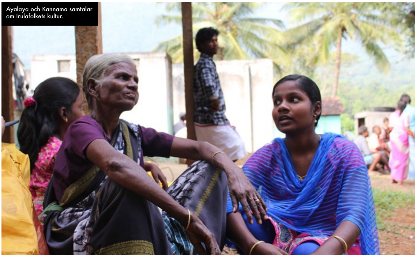
Ayalaya och Kannama samtalar om Irulafolkets kultur.