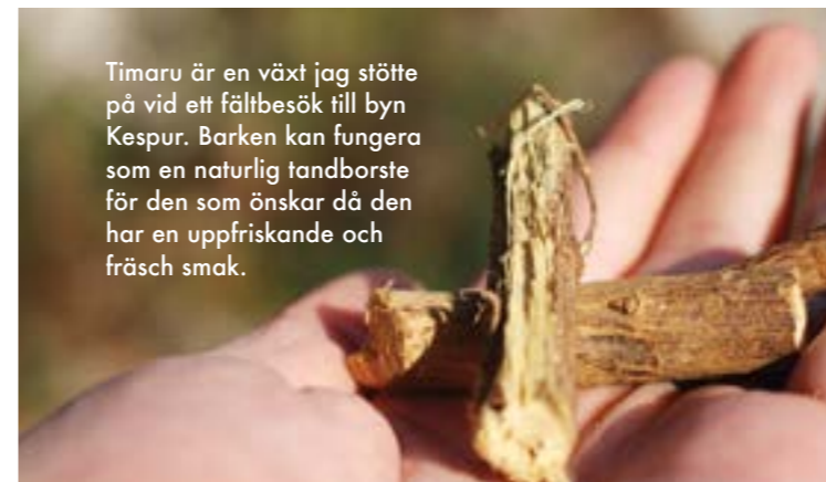
Timaru är en växt jag stötte på vid ett fältbesök till byn Kespur. Barken kan fungera som en naturlig tandborste för den som önskar då den har en uppfriskande och fräsch smak.