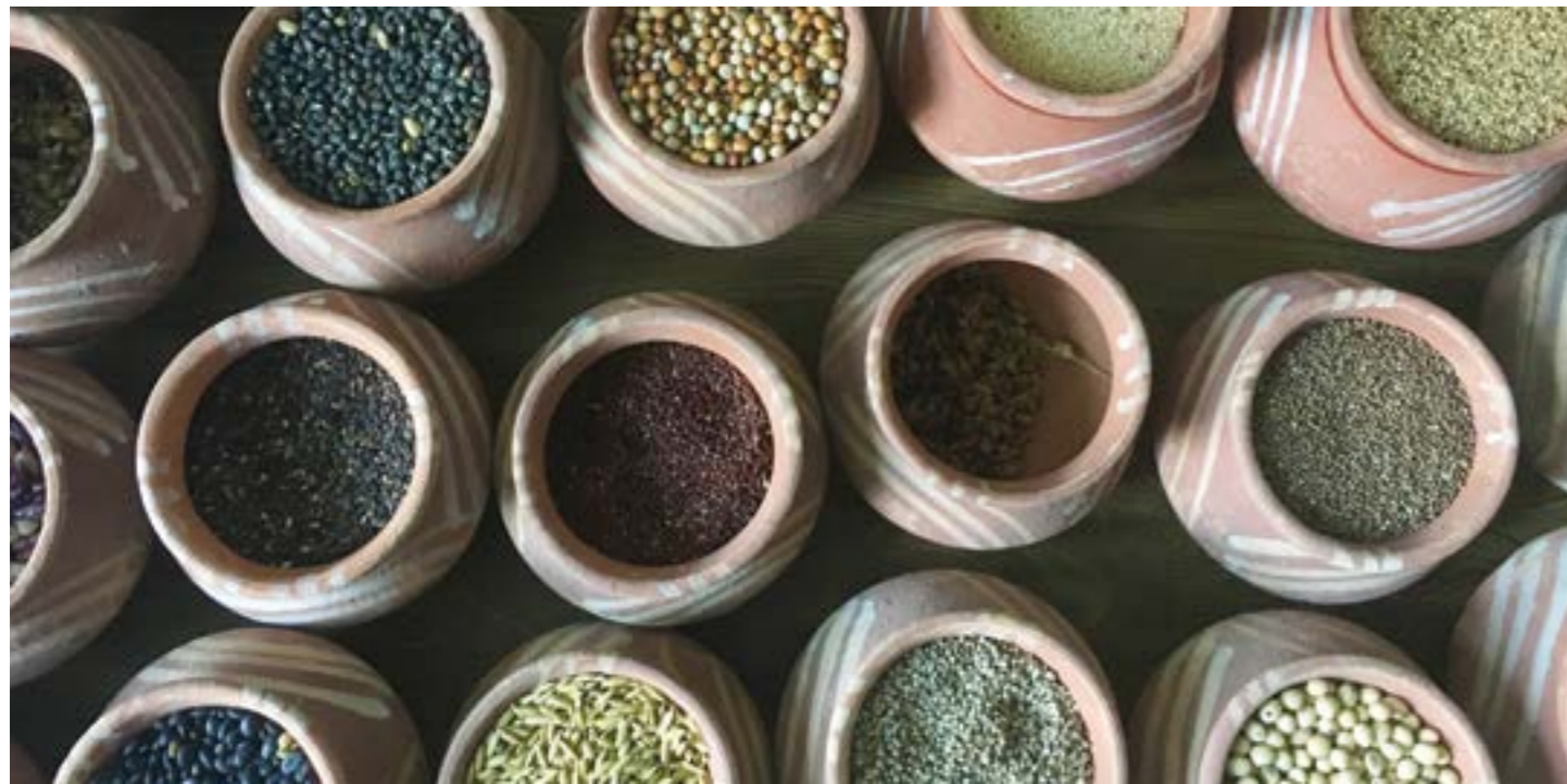
Olika typer av millets. Millets, eller hirs på svenska, har många hälsofördelar och innehåller mycket mer mineraler och proteiner än till exempel ris och vete.