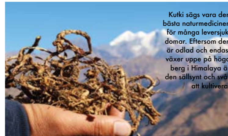
Kutki sägs vara den bästa naturmedicinen för många leversjukdomar. Eftersom den är odlad och endast växer uppe på höga berg i Himalaya är den sällsynt och svår att kultivera.