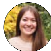
Haruna Ohldin Madurai Evidence