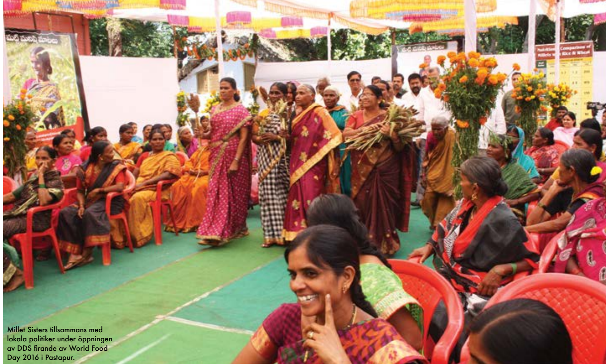
Millet Sisters tillsammans med lokala politiker under öppningen av DDS firande av World Food Day 2016 i Pastapur.