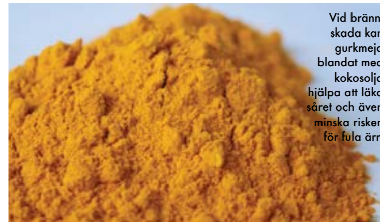
Vid brännskada kan gurkmeja blandat med kokosolja hjälpa att läka såret och även minska risken för fula ärr.