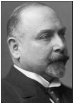
C. Th. Zable, Carl Theodor Zable, 19.1.1866-3.2.1946, dansk politiker, konseilspræsident 1909-10 og 1913-20 (fra 1918 statsminister). Zable blev cand.jur. 1890, var redaktør af Aarhus Amtstidende 1890-91 og derefter medarbejder ved Politiken. En elementær politisk og social retfærdighedssans var fra ungdommen drivkraften i hans virke på den politiske venstrefløj. Ved dannelsen af den socialdemokratisk-radikale regering i 1929 blev han atter justitsminister. Han fratrådte posten i 1935 og var 1936-39 Landstingets formand.

Således forløb i nogenlunde ro en halv times tid. I længden kunne det kommunistiske element i forsamlingen ikke holde dette ud, og under høje råb gav nogle mennesker sig til at nedbryde hegnet ind til haven og trænge den vej ind til gården. De blev dog ret og hurtigt vist tilbage.