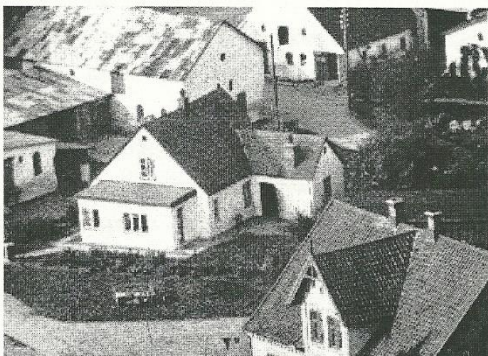
Skolevænget 1. Nybøl, luftfoto af Phrao, Ernst og Mariannes hus 1950

Endvidere har man faaet monteret nogle moderne tørreovne, der ligesom tunnelovnen er oliefyrede, eller rettere, man benytter spildvarmen fra tunnelovnen til at varme tørreovnene op med.