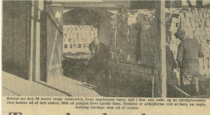
Øverst ses den 60 meter lange tunnelovn, hvor raaestens føres ind i den ene ende, og de færdigbrændte sten hentes ud af den anden, 3000 ad gangen hver fjerde time. Nederst er arbejderne ved at køre en vognladning færdige sten ud af ovnen.