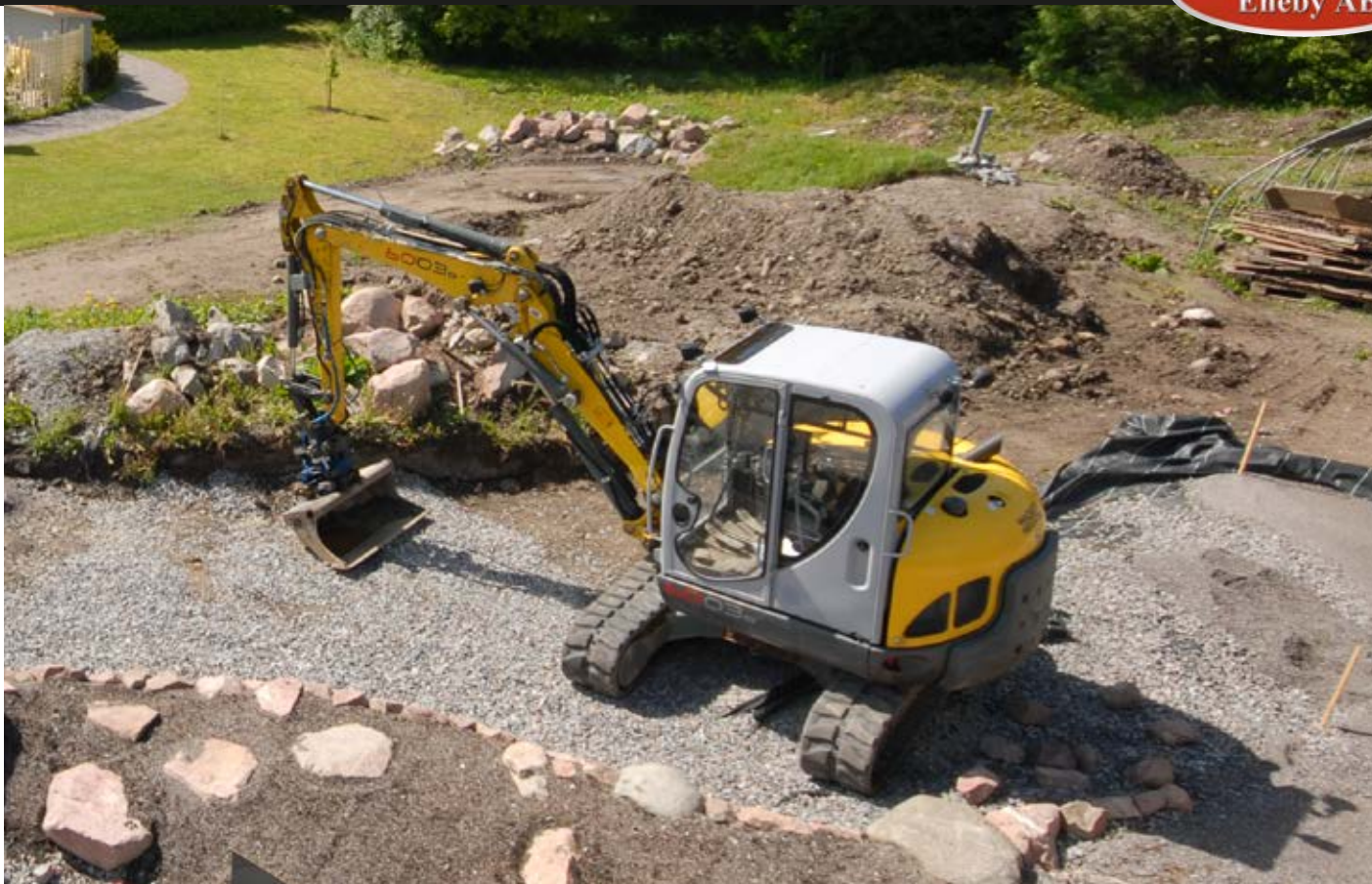
Bandgravaren Neuson 6003 har knäckbom vilket gör att man kan jobba effektivt även på trånga ytor med mycket växtlighet.