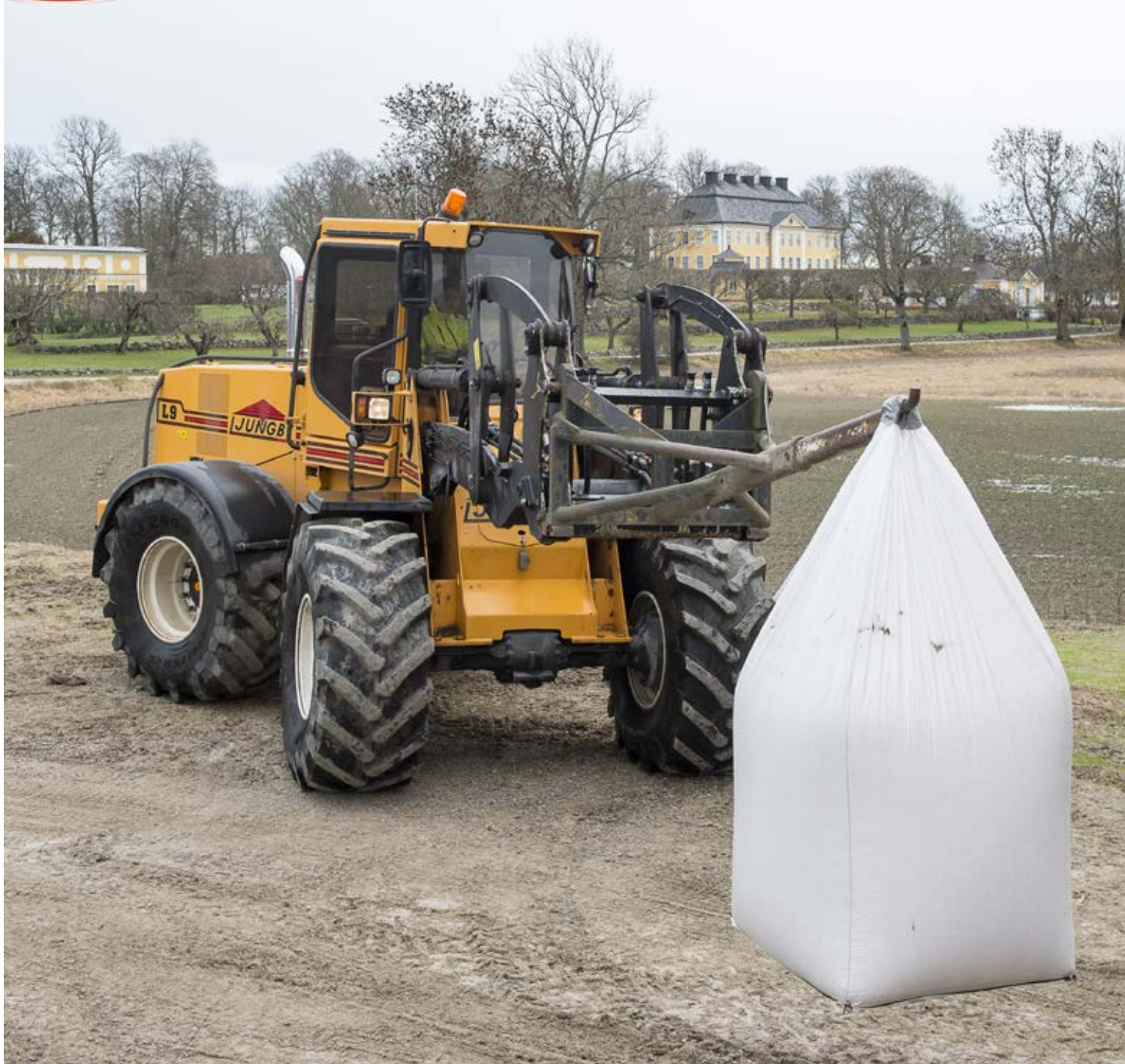
- Ljungbymaskinen är mycket mångsidig, den klarar av alla typer av lyft- och transportjobb som vi ägnar oss åt dagligen i driften av gården, säger Stefan Ranch.