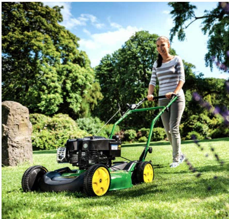
John Deeres grönytemaskiner tillhör världsledarna i sin bransch, vilket helt klart gör dem till ett varumärke som passar in i Strengbohms produktmix.