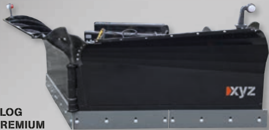
VIKPLOG HD PREMIUM