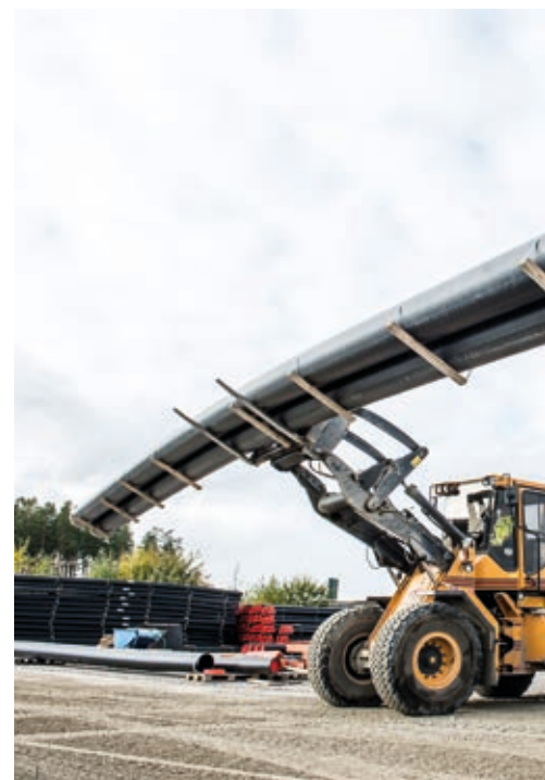
Wavin valde Ljungbys hjullastare eftersom de är robusta och driftsäkra maskiner. Hjullastarna används vid alla moment som kräver någon form av lastning eller lossning på fabriksområdet