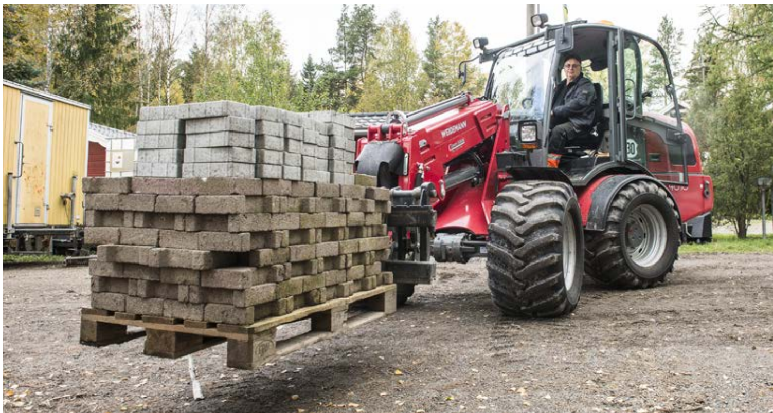
Lastmaskinen Weidemann 4070 som har teleskop används dagligen i Classes Schakts verksamhet.

KVALITETSPRODUKTER TILL PROFESSIONELLA ANVÄNDARE