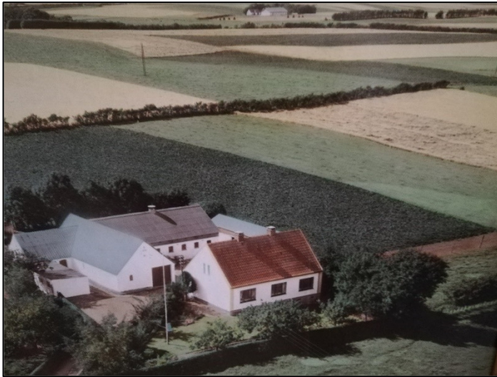
Ejendommen i Juelstrup omkring 1960