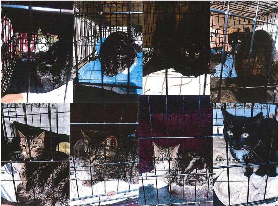
De åtta vuxna katterna som avlivades. Bilderna från veterinärintyget är av mycket dålig kvalitet men vi publicerar bilderna för att katterna inte skall glömmas.