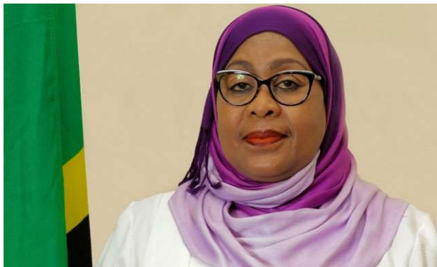
Honorable Mrs. Samia Suluhu Hassan President Tanzania

Ze stuurde een naaste medewerkster die namens het Kantoor van de President en ook namens het Kantoor van de 1 e Minister naar Arusha was gekomen om me daar te ontmoeten.