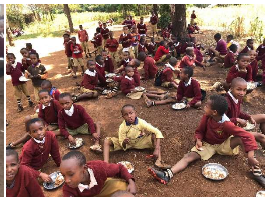
Elke dag zittend op de grond eten...

Gelukkig kwam ik hierover in gesprek met verschillende mensen en er begon in mij een (alarm)lichtje te branden en dat lichtje werkte aanstekelijk... die alarmlichten begonnen ook te werken in harten van anderen met wie ik in gesprek kwam... dit (alarm)lichtje in mij dat nu inmiddels zoveel kracht heeft, is samen met die andere (alarm)lichten, nu als "alarmlicht" afgehaakt en is als licht in