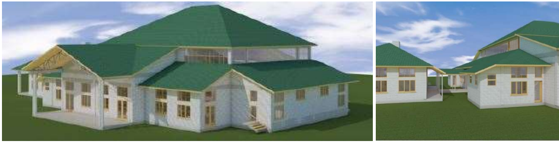
Een overzichtstekening van het Multifunctionele Centrum