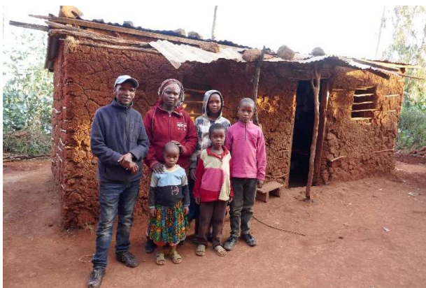
De familie voor hun oude en vervallen "huis...."

Zo kwam er, dankzij ú, dankzij jóu als donateur van Karibu, gelukkig weer l i c h t in hun leven.