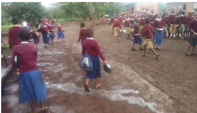
Met je bord in de hand naar de rij voor rijst en bonen.

Zo zag ik eveneens in de afgelopen maand november hoe bijna 800 kinderen van deze zelfde school elke dag hun bordje rijst met bonen met de handen en zittend op de grond moeten opeten. Soms in de stromende regen, dan weer in de bloedhitte van de felle zon van Afrika. Wanneer het zo heet is, dan ontstaat er overal veel stof op de weg dat in de lucht opwaait en op hun eten terecht komt. In dit stof zitten eitjes van wormen... en u voelt het al aankomen: deze kinderen krijgen dit ongedierte met het voedsel binnen. Het gevolg is dat bijna alle kinderen veel wormen hebben. Een situatie die vreselijk is en waar blijkbaar niets aan te doen is, omdat de school evenals de bevolking, straatarm is.