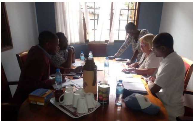
Het bouwteam in vergadering...