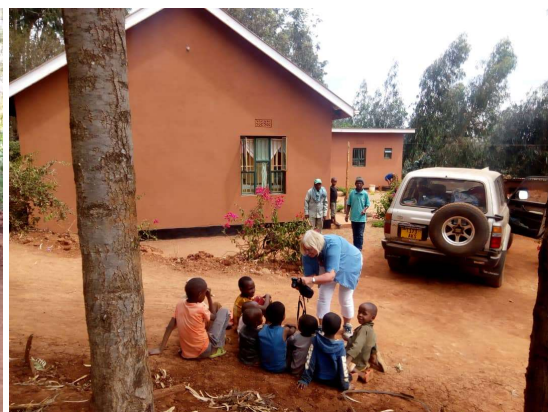
Het nieuwe huis, dankzij u als donateurs!