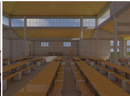
Deze ruimte biedt plaats aan 1.000 kinderen

Het resultaat van al deze bouwvergaderingen in de vorige maand is, dat we zeer binnenkort starten om dit plan te gaan uitvoeren! De architect is al samen met mij  n het onderwijzend personeel op de bouwplaats geweest. Samen met de autoriteiten hebben we ook al een bijeenkomst gehad en hebben samen de bouwplek bepaald. Deze ligt meteen naast de school; er is meer dan voldoende plek voor de constructie van dit unieke Multifunctionele Centrum.