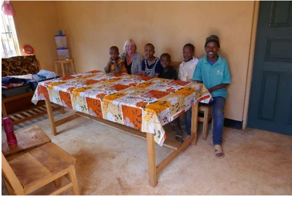
Stralend aan je eigen tafel zitten genieten....!

Daarnaast konden we gelukkig ook anderen voorzien van drinkwater, konden we kinderen naar school laten gaan, klaslokalen verbouwen van de basisschool ter plekke zodat deze tochtige ruimtes volgepakt met kinderen, met gammele kozijnen zonder glas, nu échte klaslokalen zijn voorzien van goede kozijnen mét glas en voorzien zijn van goed sluitende nieuwe deuren mét sloten. Tochtrokken werden weer klaslokalen waar de wind niet meer om je heen giert en waar regen je niet meer kan bereiken. Het zijn nu klassen waar je je aandacht weer goed bij de les kunt hebben.