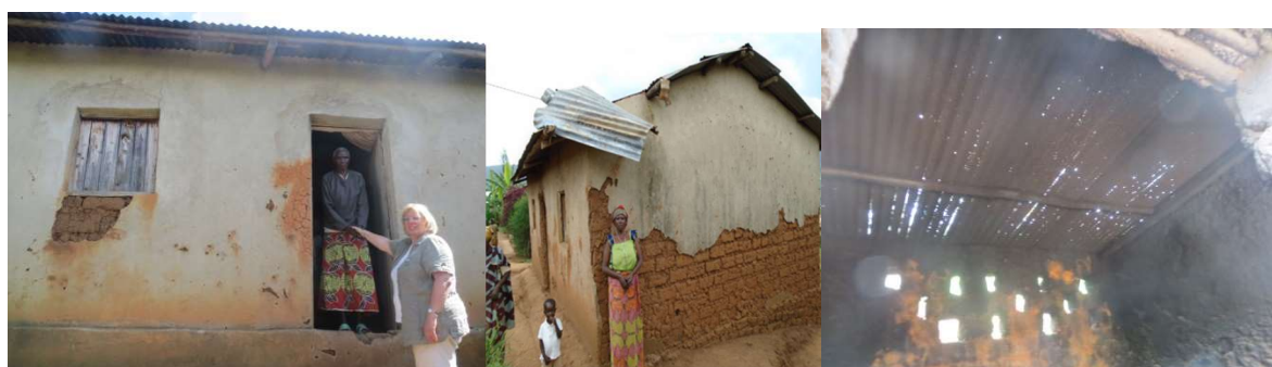
Foto links: de ingang van het huis ligt wel heel hoog.... Foto midden: een dak en een huis die aan vervanging toe zijn. Foto rechts: een dak van binnenuit gezien. Bij regen wordt echt álles nat.