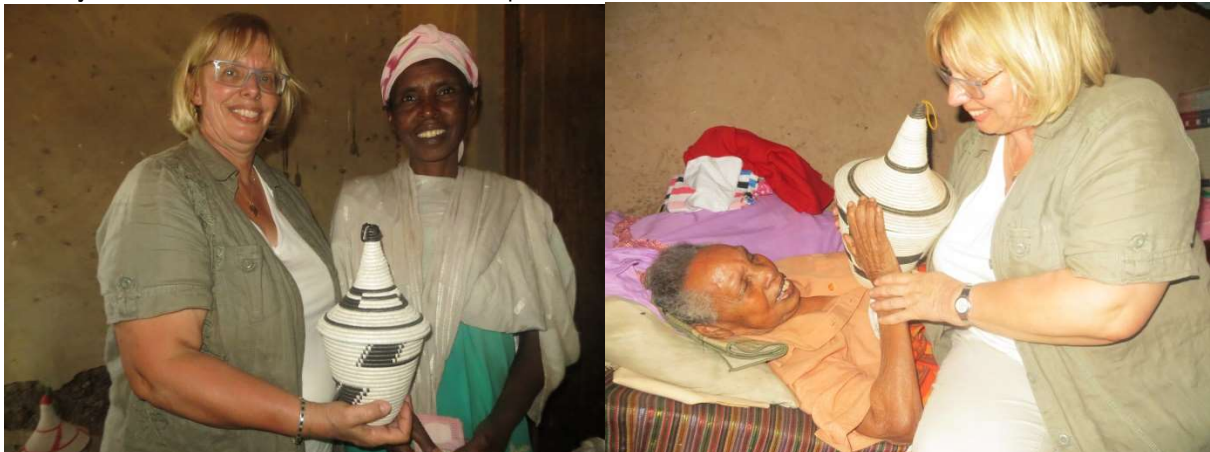
Foto links: De mand die ik aangeboden kreeg en waar voor deze weduwe toekomst in zit door middel van het opzetten van een handel hierin.

Ik kreeg een mand aangeboden van één van deze vrouwen, die dit artistieke handwerk op een bijzondere manier "in de vingers" heeft. Ze wil met deze kunstzinnige hand -arbeid in de toekomst haar bron van inkomsten maken. Graag wil ik haar helpen om afname van deze manden in Nederland mogelijk te maken. Het zijn manden met de bekende "punt".