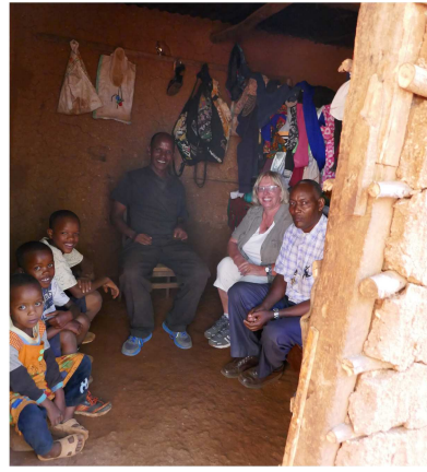
Overleg over directe en snelle hulp...