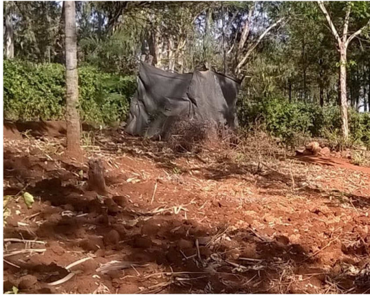
Het huidige toilet voor een gezin van 6 personen