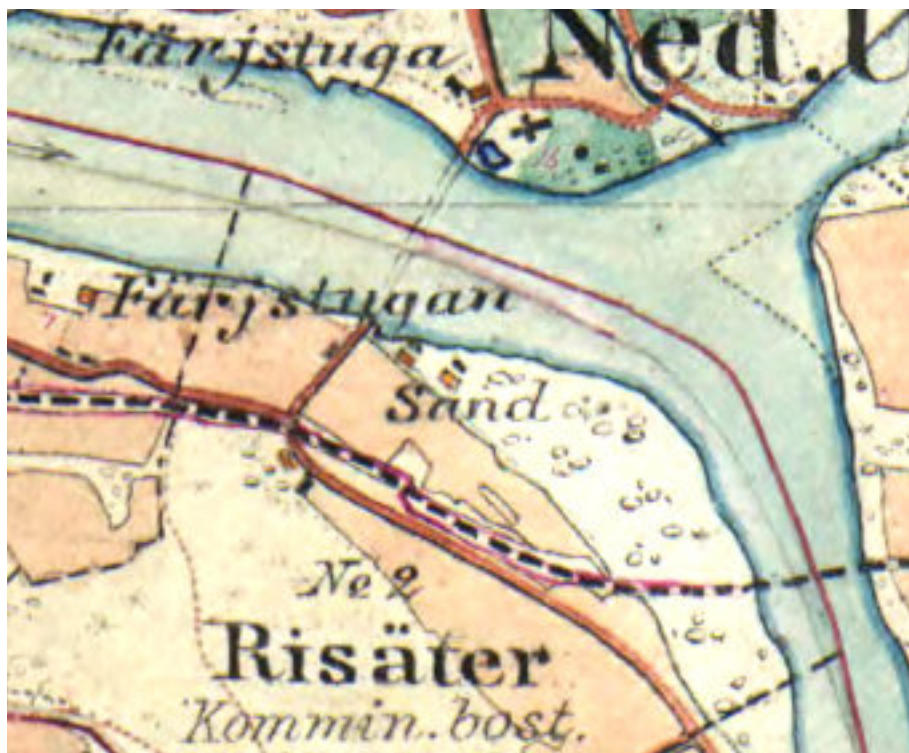
Risätter i Nedre Ullerud på Häradsökonomiska kartan från 1880-talet