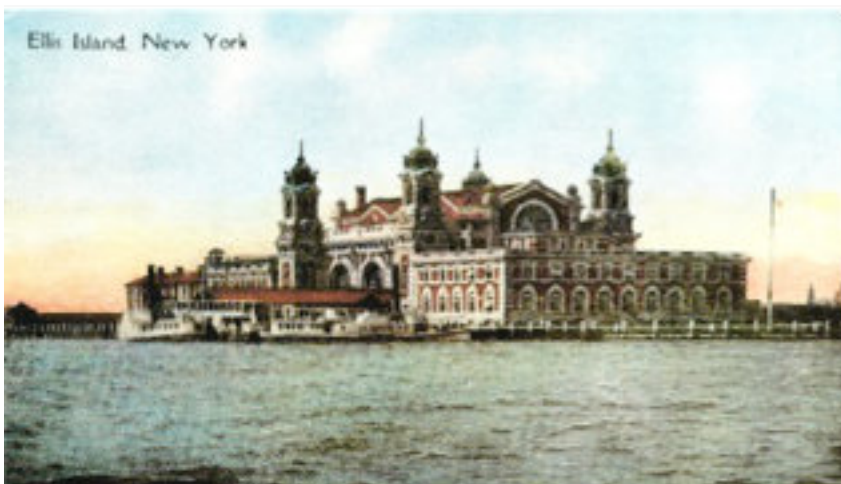
Ellis Island. Var i bruk 1892-1954.