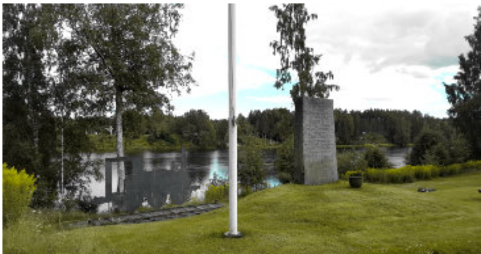
Lyckans lastplats som ligger utmed väg 62 vid Lyckan cirka 5 km söder om Forshaga.

I häradsrättens protokoll kan man läsa en lång utläggning om hur och när buteljerna hade tagits och vem som hade gett till vem. Man kan konstatera att deras vittnesmål inte var helt enhetliga. Värde av det stulna vinet var cirka 17 riksdaler banco