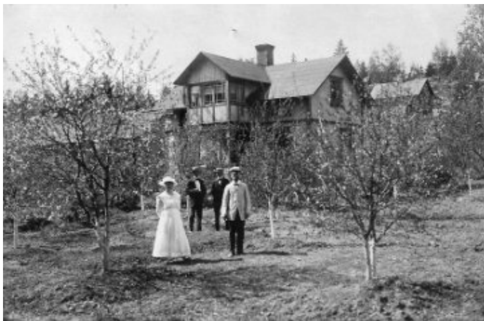
Liljelund, bild från tidigt 1900-tal. Personerna har inget samband med de som nämns i artikeln. Är detta gamla Djupdalen?