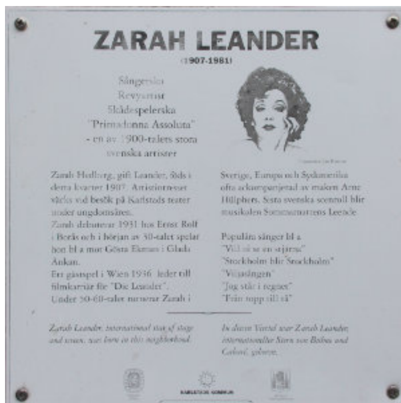
Minnestavlan som finns nära Zarah Leanders födelseplats på Kungsgatan i Karlstad.

Den tes som drivs i artikeln är rätt anmärkningsvärd. Det skulle nämligen vara så att Sara Stina Hedberg, född 15 mars 1907, inte skulle vara född i Karlstads stadsförsamling utan på Vatterud i hemmanet Treskog i Gunnarskog!