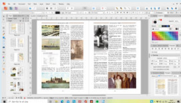
Skärmdump från pågående arbete i layoutprogrammet "Affinity Publisher"

Vi är glada för alla som skickar in artiklar med bilder till VärmlandsAnor. För att göra det lättare för mig när jag gör tidningen och för att kvalitén ska bli så bra som möjligt på bilderna önskar jag mig att bilderna alltid skickas med separat. Helst också texterna separat i word. Vill ni visa var bilderna ska komma i förhållande till texten så kan ni ju skicka med ett dokument med bilderna inklistrade om ni vill men jag måste ändå anpassa dem till respalt och till layouten i övrigt. Jag föredrar också att ni inte gjort något med bilderna. Jag jobbar ändå med bilderna för att de ska se bra ut i tryck.