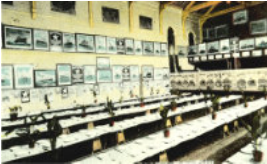
Så här kunde ett emigranthem i Hull eller Grimsby se ut vid den här tiden

lantångare i början av 1930-talet. Emigrationen var över och de myckna gamla slitna fartygen behövdes inte längre.