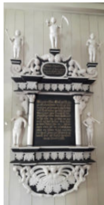
Britta Rokes epitafium.