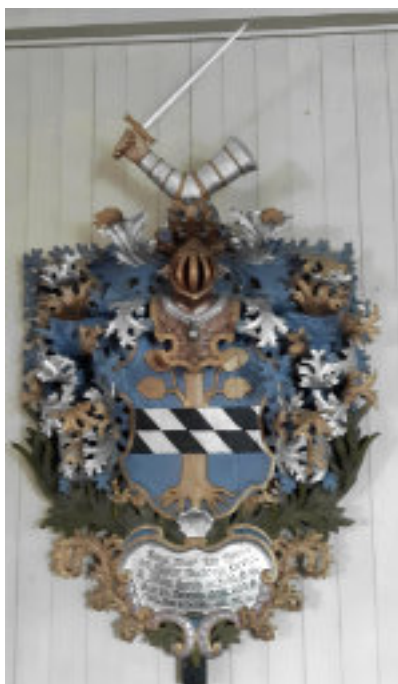
Johan Linroths huvudbanér.

Även om det är många värmlänningar och andra som kan få med ätten Linroth i sina antavlor genom ättlingar på kvinnolinjerna – så var sönerna dåliga på att föra ätten vidare och till slut utlocknade ätten Linroth den 10 maj 2011, då den siste Linrothen dog i England. Detta verkar inte ha vållat någon större uppmärksamhet, och diskussionen om Linroth är kort i t.ex. Anbytarforum. Något krossande av ättens sköld ägde inte rum.