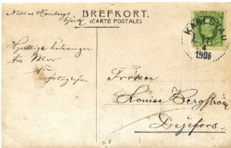
Baksidan av brevkortet på Hambergs björk

men nu när artikeln ska skrivas är det helt omöjligt. Kanske någon av VärmlandsAnors läsare sitter inne med svaret.