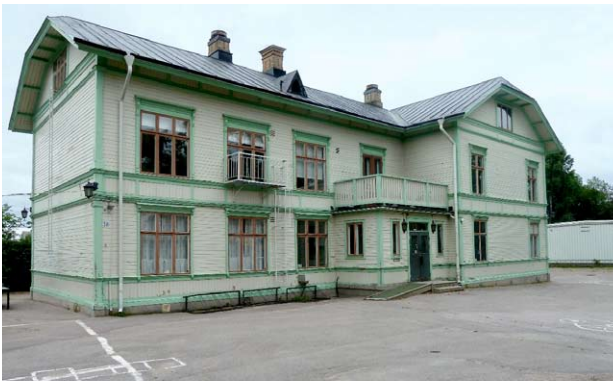
Gamla Flickskolan i Kristinehamn, numera Jakobsbergsskolan, fotograferad 2016.