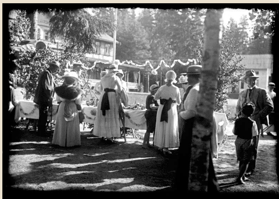
Utanför Stora hotellet på Skagersbrunn, Rudskoga. Foto, Pontus Andersson, eller någon av hans anställda, cirka 1920.

Platsen för fotograferingen är kurorten Skagersbrunn i Rudskoga, där bland andra, Pontus Andersson, hade sommarateljé. Många fotografer använde denna kuliss som bakgrund.