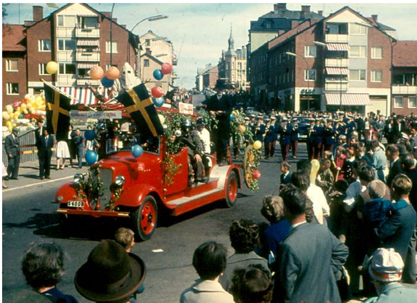
Folkfest i Säffle! Året är troligen 1961 och det handlar om Barnens Dag.

Nr 1 Mars 2017 Medlemstidning för Värmlands Släktforskarförening Årgång 34