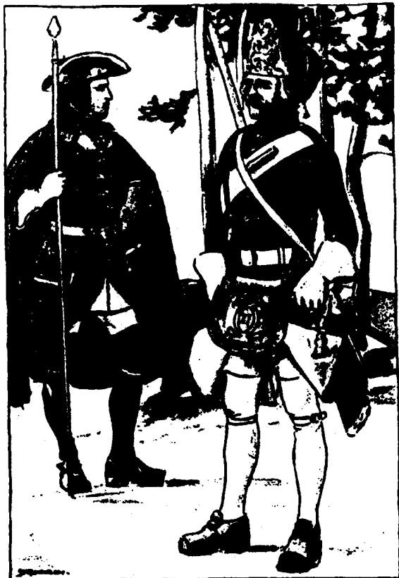
Kungl. Närkes och Värmlands Reg. Officer, Grenadjär, 1690.

diskuterade val av knektar i tingsstugan. När förrättningen var klar fördes de till knektar uttagna männen upp på en utskrivningslängd. I utskrivningslängden stod knektarna tills de slutligen mönstrades som soldater och uppfördes i en ny rulla.