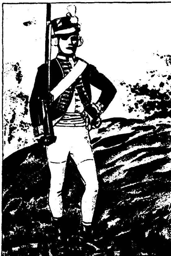
Kungl. Närkes och Värmlands Reg 1778.

Välkomna till Värmlandsarkiv för att spåra Era förfäder i de värmländska knektlängderna.