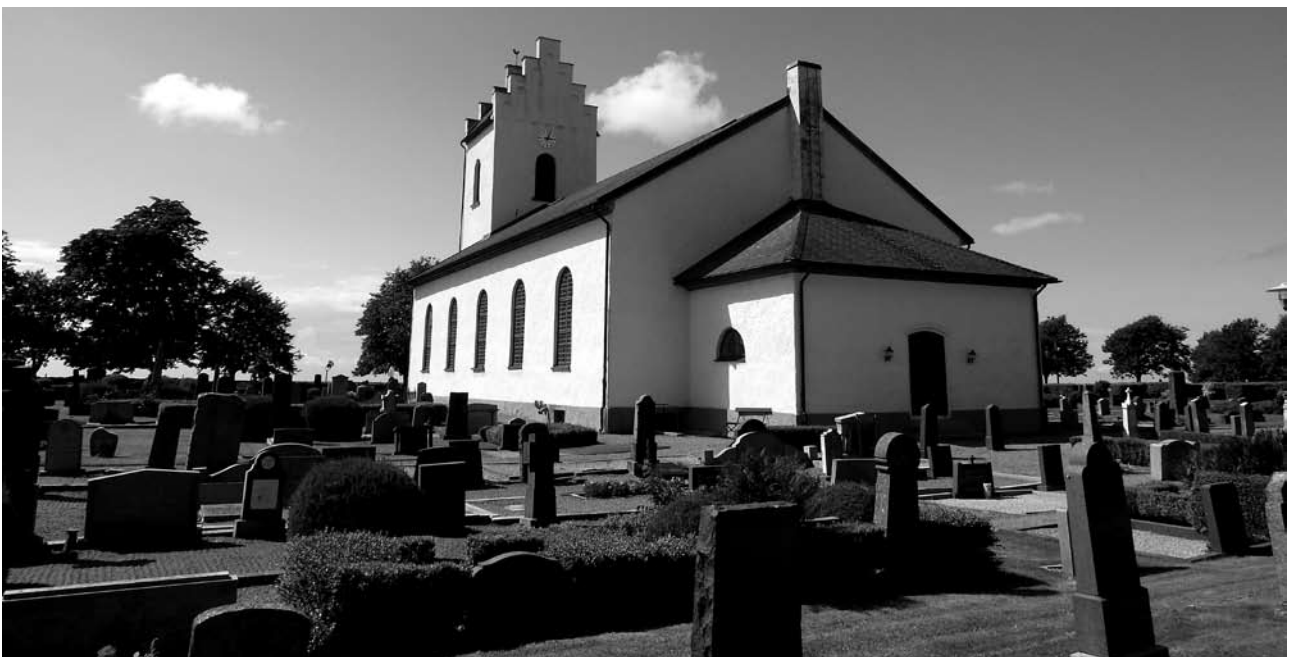
Hovs kyrka i Skåne.