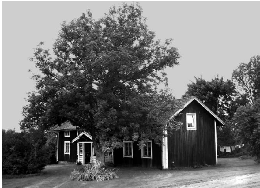
Mangårdsbyggnaden på By september 2016.

Sedan sällskapet spisat och druckit det åldriga Brudparets skål, börjades Dansen af bägge de gamle, som wid sin höga ålder wisade owanlig munterhet och styrka, fortsattes derpå först af Barn och Barnabarn,