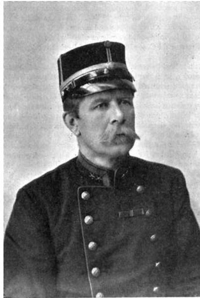
Overstelöjtnant vid Generalstaben 1900.

Vad som lockade honom hos värmlänningarna var – berättar han själv i sina memoarer – ”den gröna jägaruniformen med sina snören och