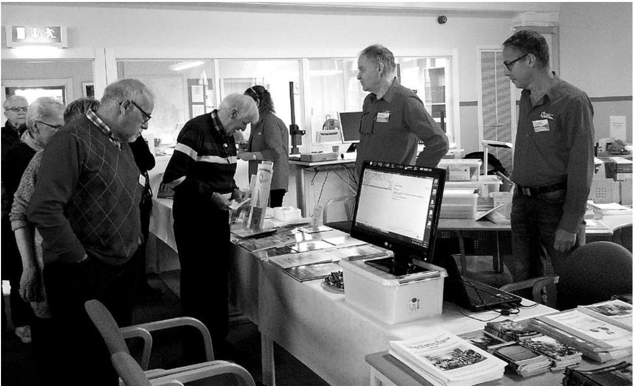
Arkivens Dag på Arkivcentrum den 14 november.