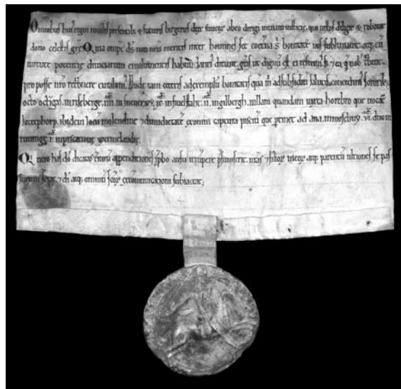
Bilden visar Birger Brosas gåvobrev från omkring år 1200 (DS 823). Brevet är skrivet på latin, och under brevet hänger Birger Brosas vackra ryttarsigill. Värmland (Wermelandie) står som sista ord på tredje raden nedifrån.

En viktig och mycket intressant källa för Värmland är en skattebok från 1503 som listar skattegårdarna i nästan hela Värmland, förutom några områden i sydväst och sydost. Nästan hela Nordmarks härad saknas, eftersom häradet hörde till Dalsland. Endast Silleruds socken i Nordmarks härad finns med, då socknen räknades till Gillbergs härad 1503. Likaså saknas Visnums härad och Värmlandsberg. Skatteboken är unik i sitt slag och innehåller en detaljerad förteckning över skattebeloppen för alla skattegårdar. I förteckningen redovisas dessutom hur varje gård betalade skatten – i form av pengar, oxar, kor, stutar, lax eller mårdsinn. Av källan framgår också vilka gårdar som gick samman för att gemensamt erlägga taxer