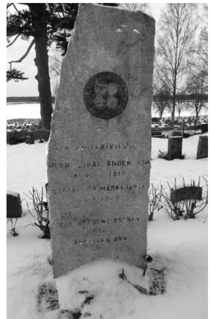
Bernt Anderssons gravsten på Grums kyrkogård. Gravstenen tillkom efter en insamling och avtäcktes den 18 maj 1941. Foto: Carl-Johan Ivarsson, januari 2016.

förrän sovjeterna anföll. Men de anföll med en alltför liten styrka. Alla stupade utom någon man som lyckades ta sig tillbaka och larma. Efter bara någon timme anföll sovjeterna igen, men med en betydligt större styrka. Sovjeterna hade det kämpigt i den djupa snön varför de blev ett lätt mål för frivilligkompaniet, som förfogade över kulsprutor och automatiska eldhandvapen.