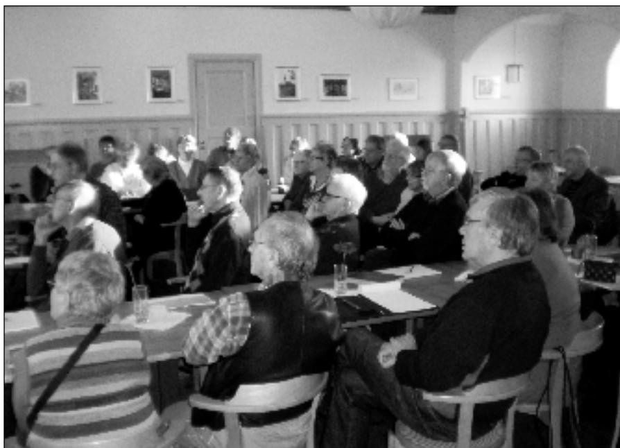
En uppmärksam skara daglediga.