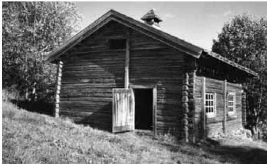
En rökstuga/bastu från Öyeren i Brandval finnskog, strax innanför gränsen på norska sidan. Troligen användes byggnaden både till bastubad och kanske även till bostad.