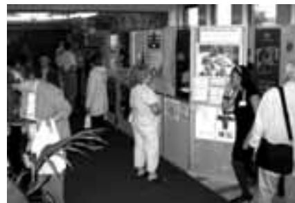
En av alla innehållsrika informationsskärmar

lokala, fler än vid någon tidigare riksstämma, visade sina olika alster i form av böcker, antavlor, CD-skivor mm. Hela fyra plan i stadens teater hade tagits i anspråk. Man räknar med att antalet besökare uppgick till cirka 7500.